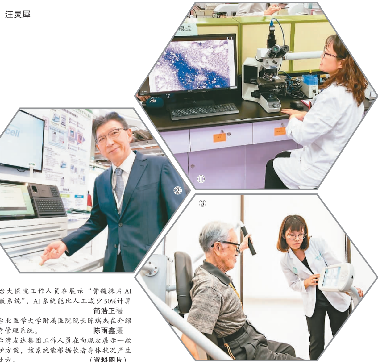
图①：台大医院工作人员在展示“骨髓抹片AI自动分类计数系统”，AI系统能比人工减少50%计算时间。

台湾盛弘集团首度率旗下六大子公司参加2019台湾医疗科技展。盛弘董事长刘庆文表示，公司看好大健