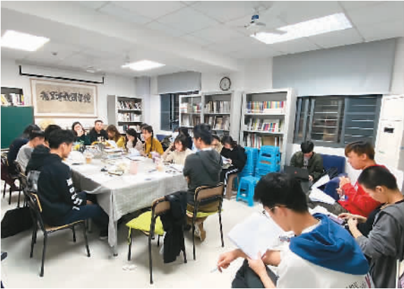
▲写作班的同学们在评委会上展开讨论。

么》的文章中写道：“我也不以为作家是可教授的，凡创造性的劳动似都仗天意神功。”转而笔锋一宕，又说教写作就像匠人手艺，比如对文字的理解、安排情节和故事等，是人力可为的部分。