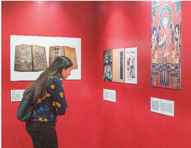
1月4日，“阅读中国”图书展暨“中印文化交流图片展”在印度首都新德里举行。图为参观者在观展。