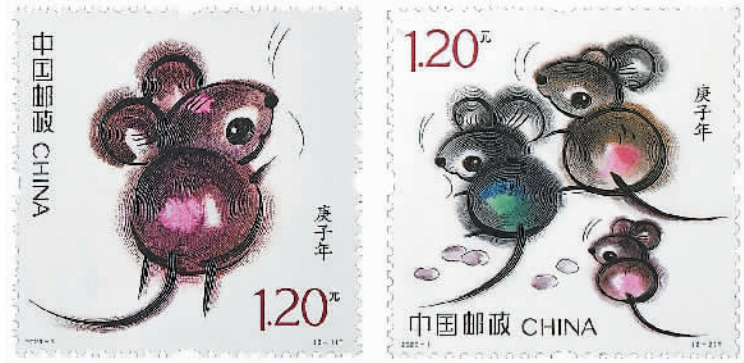
2020年是庚子鼠年。1月5日，《庚子年》特种邮票首发仪式在北京举行。图为《庚子年》特种邮票1套2枚。