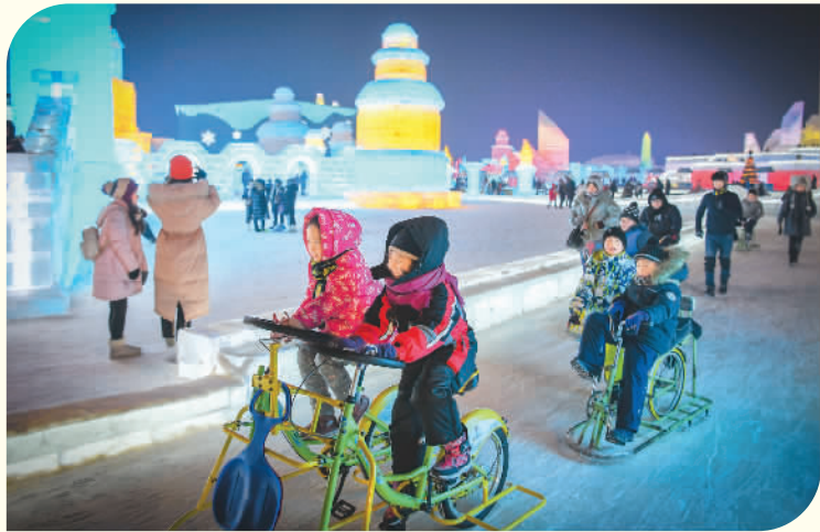
游客在冰雪大世界园区游览。