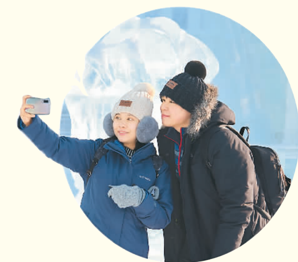
游人在哈尔滨冰雪大世界园区自拍。