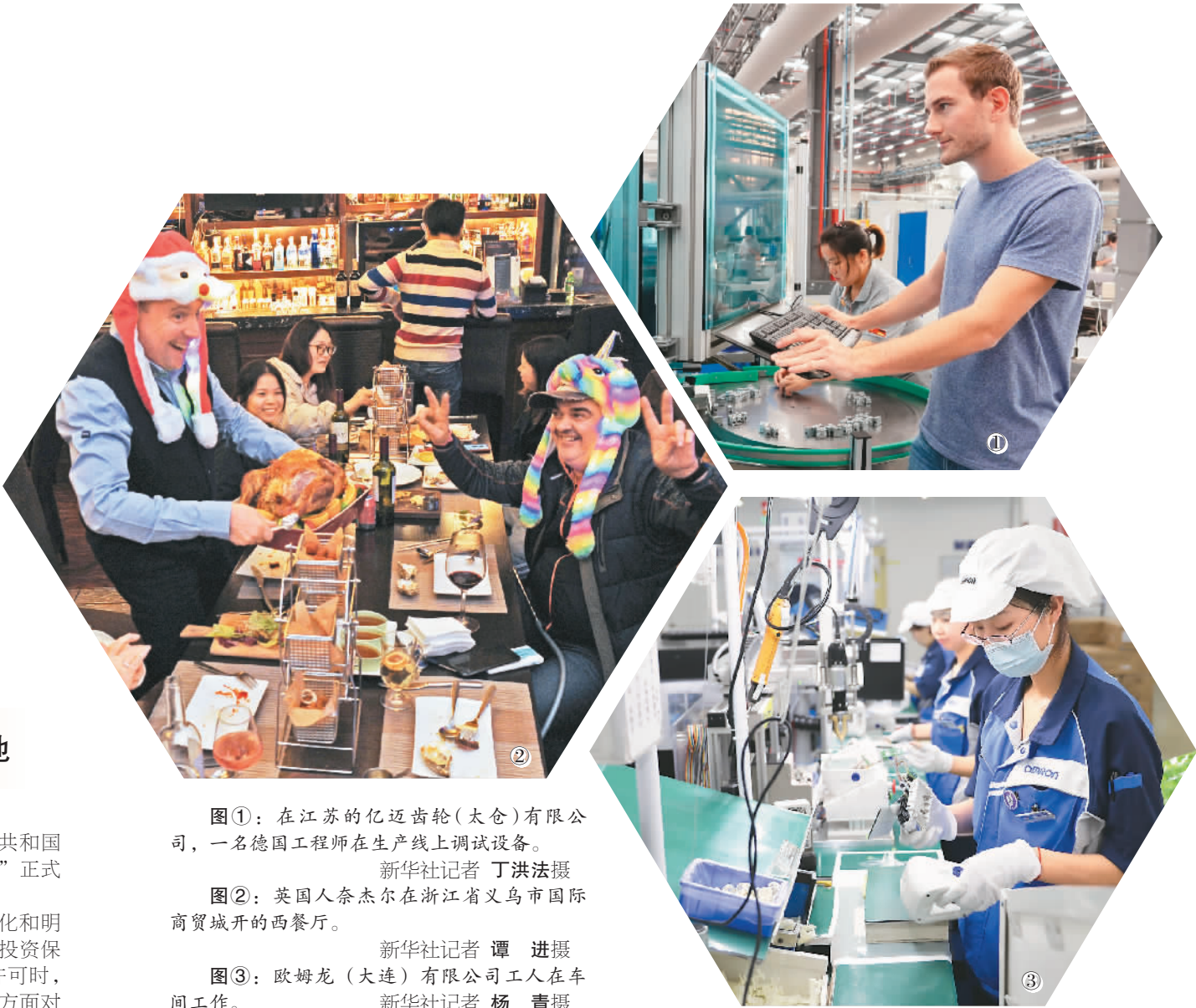
图①：在江苏的亿迈齿轮（太仓）有限公司，一名德国工程师在生产线上调试设备。

着力推进对外开放。发布了2019年版全国和自贸试验区外商投资负面清单，全面清理负面清单以外外资准入限制措施。谭绮注意到，本次修订进一步精简了外资准入负面清单，全国外资准入负面清单条目由48条措施减至40条，自贸试验区外资准入负面清单条目由45条减至37条。该次修订在服务业、制造业、采矿业、农业领域推出了新的开放措施，在更多领域允许外资控股或独资经营，