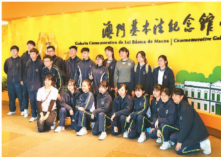
澳门基本法纪念馆设在澳门综艺馆内，分为“一国两制”的方针、宪法与澳门基本法等展区。2013年开馆以来，超过24万人次参观了纪念馆。图为澳门大学附属应用学校师生在澳门基本法纪念馆合影。

“《我和我的祖国》歌词太美了，充满了诗情画意，说出了我心里对祖国的感情。我以后会继续学习更多这样好听的歌，希望祖国今后越来越好。”沈静柔说。