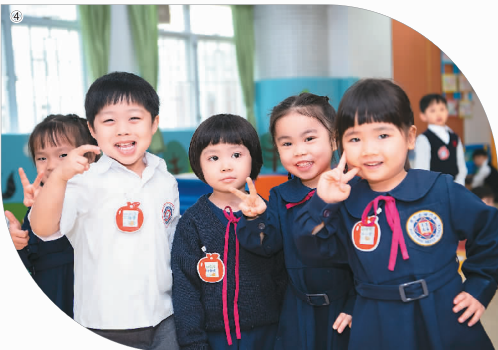
图①：1999年，澳门市民挥舞着国旗和区旗，庆祝澳门回归祖国。（资料图片） 图②：澳门举行“2019澳门国际幻彩大巡游”，庆祝回归祖国20周年。 图③：驻澳门部队举行军管开放日活动，女兵进行摩托车驾驶演示。 图④：澳门小学生在课间愉快玩耍。（资料图片）