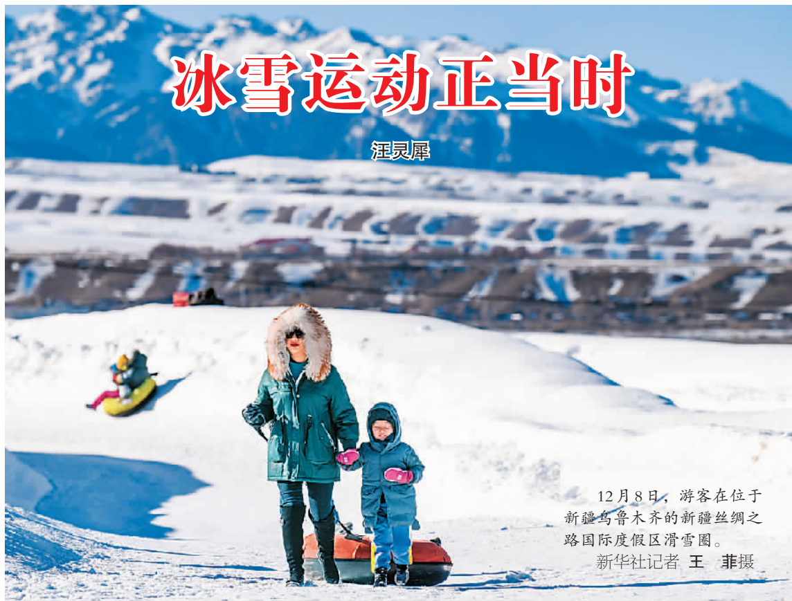
12月8日，游客在位于新疆乌鲁木齐的新疆丝绸之路国际度假区滑雪场。

凛冽的寒风本是冬季的代名词，也是很多城市的旅游淡季。但在北京冬奥会筹办热度的推动下，全国各地冰雪运动持续升温，寒冷的冬季如今已经火了起来。