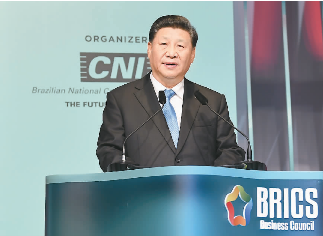
当地时间11月13日,金砖国家工商论坛闭幕式在巴西利亚举行。国家主席习近平出席并发表讲话。