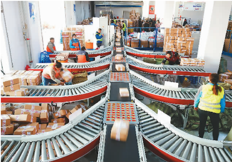
11月11日，在江苏省连云港市海州区天马电商产业园，工作人员正在加紧发送快递包裹。