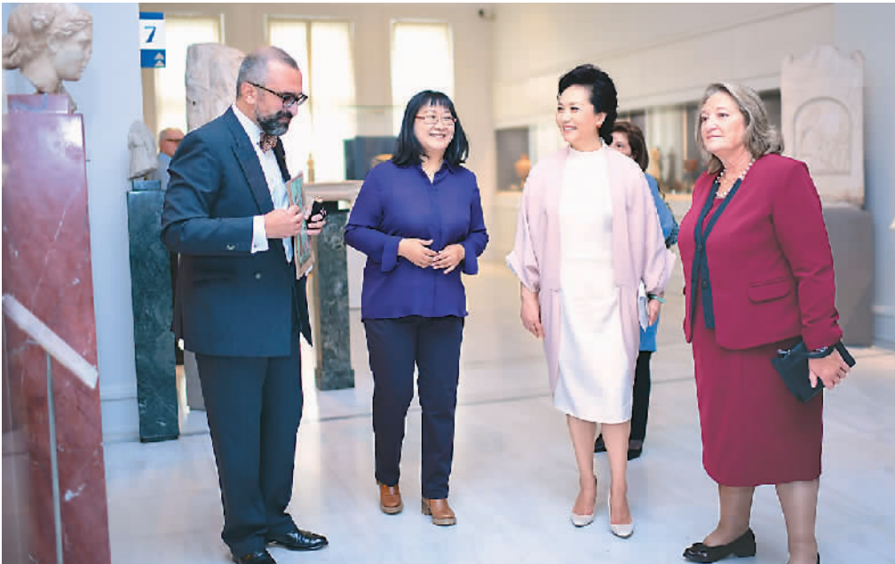
当地时间11月11日上午，国家主席习近平夫人彭丽媛在希腊总统夫人弗拉西娅陪同下参观位于雅典市中心的贝纳基博物馆。

旗手传媒集团是巴西主流综合性商业媒体集团，其电视台、电台的影响力长期位居巴西和南美洲前列。旗下拥有40多个传媒品牌，覆盖人口超过1.5亿。