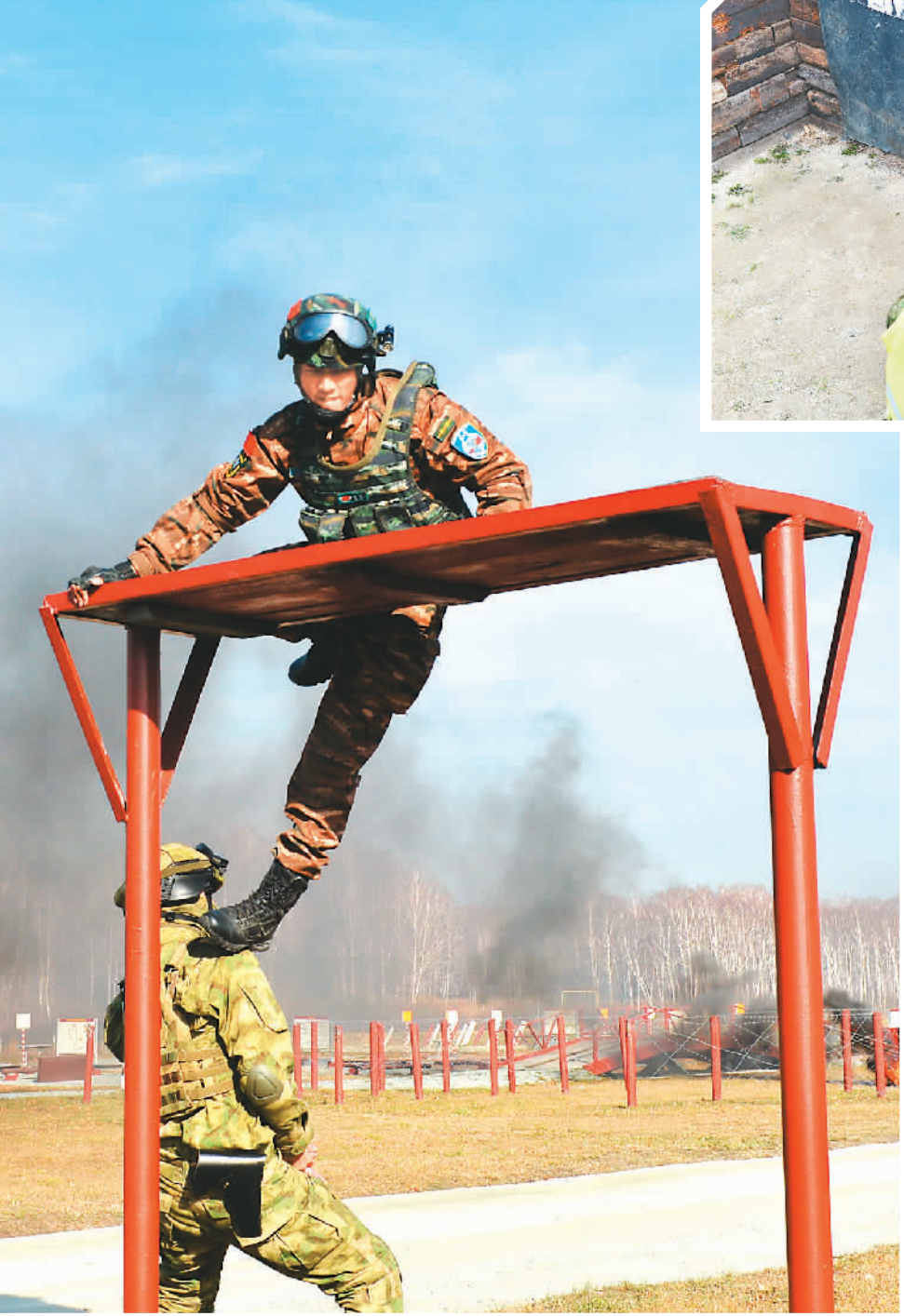
中俄参演官兵开展战术越障训练。