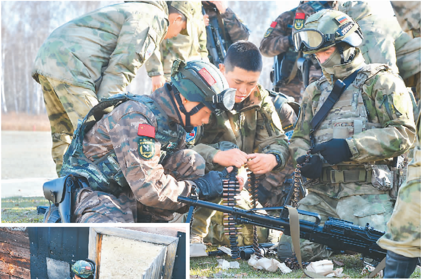
▲ 反恐演练中，中俄参演队员相互协作。 ▲ 开展房间突入训练。 ▼ 中俄参演官兵并肩战斗。