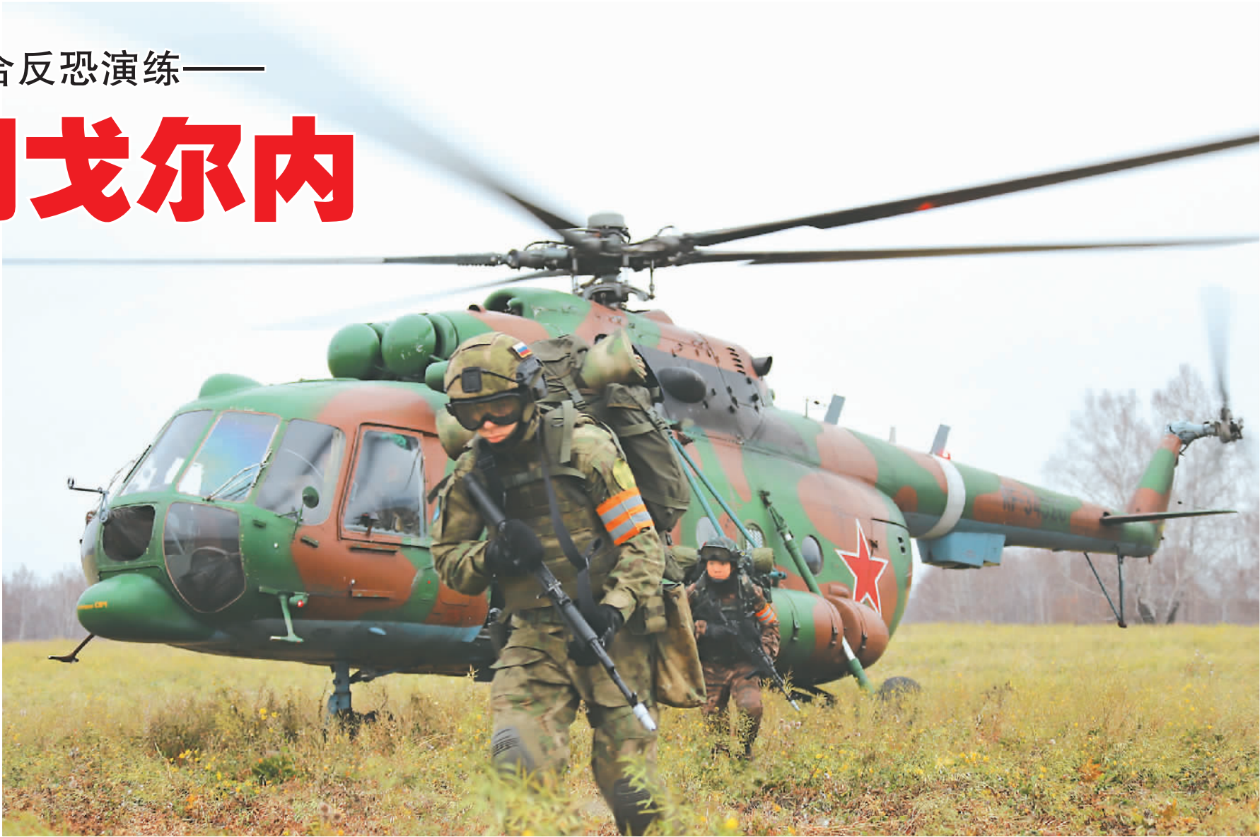
▲ 在反恐演练中，中俄参演官兵在机降后迅速出动。 ▼ 参演官兵开展柔术训练。

战鹰呼啸，铁甲奔流，硝烟弥漫。 中国武警部队与俄罗斯国民卫队“合作-2019”联合反恐演练，日前在俄罗斯新西伯利亚市近郊的“戈尔内”训练中心及周边地域举行。此次演练按照“实战化、对抗化、基地化”的思路，主要进行了联合反恐基础技术训练、战术协同训练、综合对抗演练和理论研讨交流4大类近30个课目的训练和交流。 这次联合反恐演练，中俄双方成立联合指挥部和训练队，实行联合指挥、混合编组、集中组训。其中，中国武警部队派出猎鹰突击队，俄国民卫队派出“叶尔马克”独立特种作战部队。 作为此次联演的“重头戏”，在为期2天1夜的搜剿恐怖团伙综合对抗演练中，面对严寒阴雨天气和陌生复杂地形，联训队采取空地协同投送、分片搜索打击、昼夜连续实施等方式，对潜藏在丛林地的恐怖分子实施清剿，期间有效处置导调组随机设置的各类情况20余种，全面锤炼特战队员的战术素养、战斗技能和意志品质。 在此次联合反恐演练中，中俄官兵精诚团结、默契配合、密切协作，在反恐训练理念、专业技能、作战指挥等方面进行了深入交流。通过联演，一批反恐作战高强度、高难度课目得到检验，参演分队联合指挥、战术协同和综合保障能力得到有力提升。