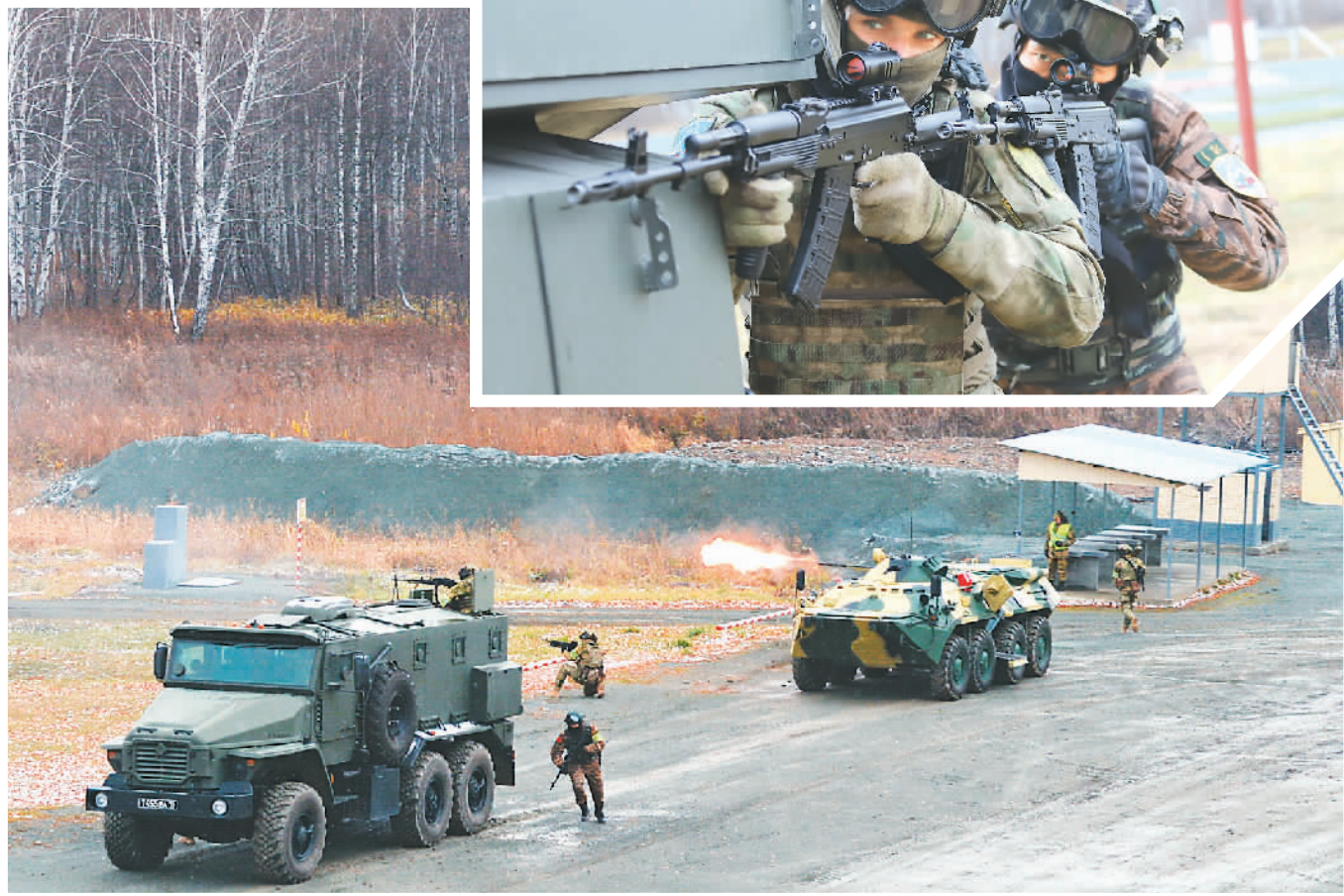
步兵装甲车协同火力打击训练。