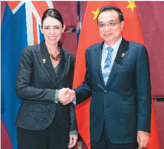
李克强会见新西兰总理阿德恩。