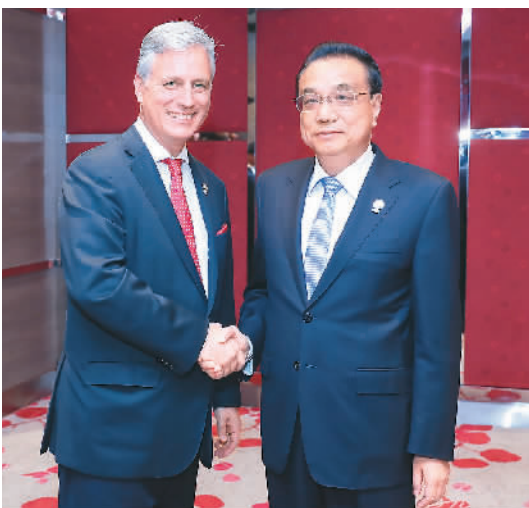
李克强会见美国总统国家安全事务助理奥布莱恩。