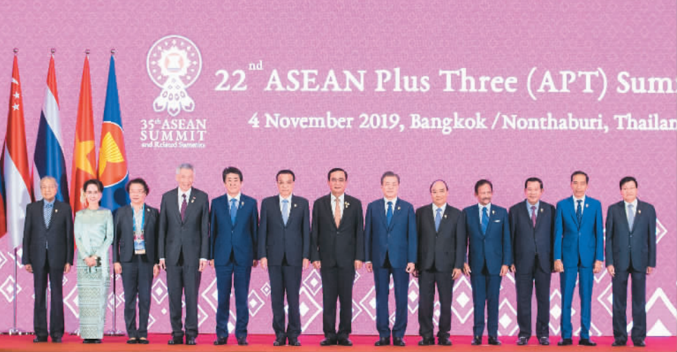
11月4日，国务院总理李克强在泰国曼谷出席第22次东盟与中日韩（10+3）领导人会议。图为与会领导人集体合影。