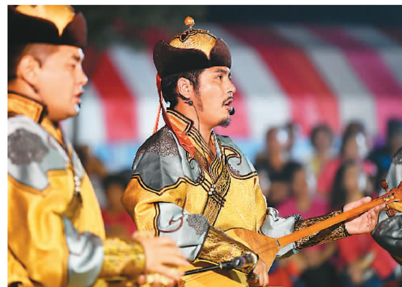
近日，“小林平埔夜祭”在高雄市甲仙区平埔文化园区举行。台湾地区少数民族平埔人后裔的聚落——小林部落和内蒙古非遗团队一起，载歌载舞，共同表达对风调雨顺的期盼。图为内蒙古非遗团队演员在小林部落夜祭活动上表演。