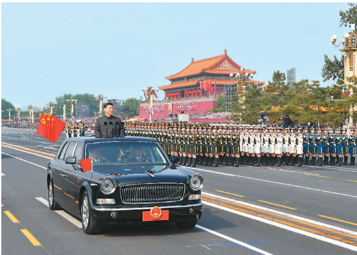
图为中共中央总书记、国家主席、中央军委主席习近平检阅受阅部队。