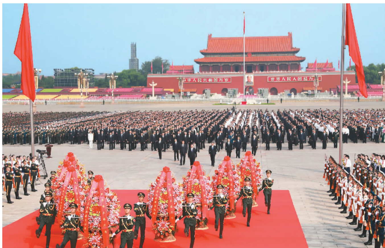
9月30日上午,习近平、李克强、栗战书、汪洋、王沪宁、赵乐际、韩正、王岐山等党和国家领导人来到北京天安门广场,出席烈士纪念日向人民英雄敬献花篮仪式。新华社记者 庞兴雷摄

庄严的天安门广场上,鲜艳的五星红旗迎风招展。广场两侧,巨型主题景观雕塑“红飘带”分外引人注目。巍然耸立的人民英雄纪念碑北侧,两组花坛上镶嵌着用白色菊花等编织成的18个花环,寄托着全国人民对英烈的深切缅怀。临近10时,习近平、李克强、栗战书、汪洋、王沪