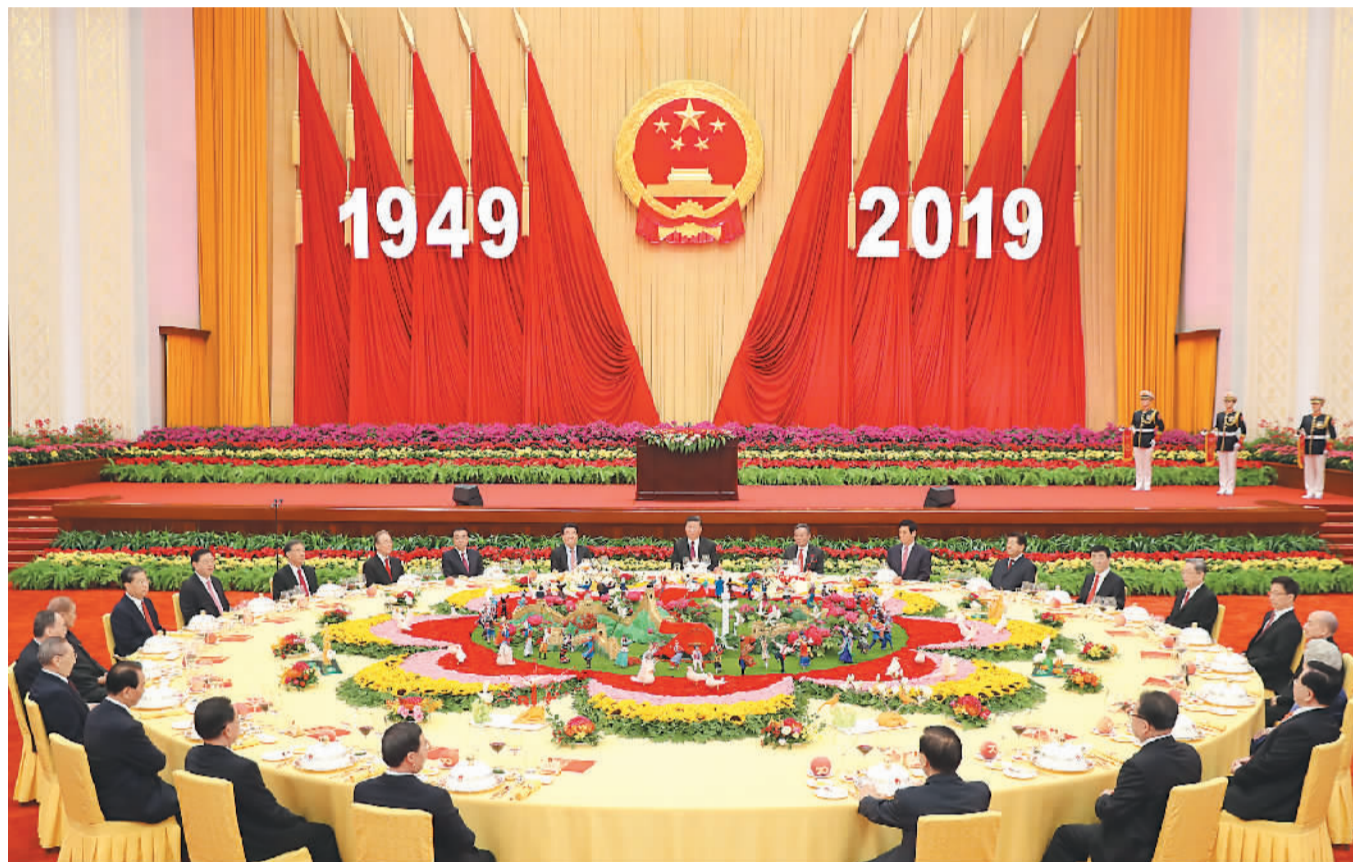
习近平、李克强、栗战书、汪洋、王沪宁、赵乐际、韩正、王岐山等党和国家领导人与4000余名中外人士欢聚一堂,共庆新中国70华诞。新华社记者 黄敬文摄

本报北京9月30日电 (记者张烁) 庆祝中华人民共和国成立70周年招待会30日晚在人民大会堂隆重举行。中共中央总书记、国家主席、中央军委主席习近平出席招待会并发表重要讲话。他强调,在新的征程上,我们要高举团结的旗帜,紧密团结在党中央周围,巩固全国