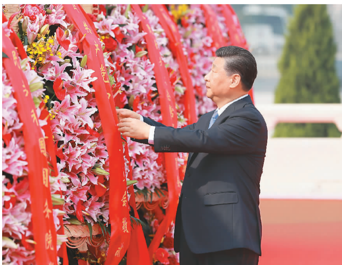
9月30日上午,习近平、李克强、栗战书、汪洋、王沪宁、赵乐际、韩正、王岐山等党和国家领导人来到北京天安门广场,出席烈士纪念日向人民英雄敬献花篮仪式。图为习近平整理花篮上的缎带。

本报北京9月30日电 (记者张烁) 在庆祝中华人民共和国成立70周年之际,烈士纪念日向人民英雄敬献花篮仪式30日上午在北京天安门广场隆重举行。习近平、李克强、栗战书、汪洋、王沪宁、赵乐际、韩正、王岐山等党和国家领导人,同各界代表一起出席仪式。