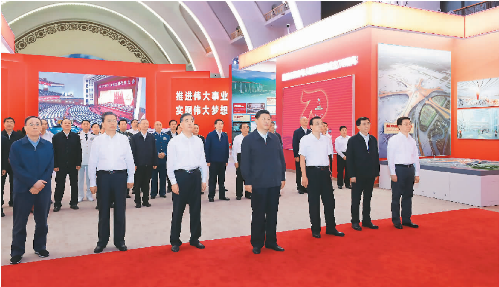
9月23日,党和国家领导人习近平、李克强、汪洋、王沪宁、赵乐际、韩正、王岐山等在北京展览馆参观“伟大历程 辉煌成就——庆祝中华人民共和国成立70周年大型成就展”。

本报北京9月23日电(记者姜洁)在庆祝中华人民共和国成立70周年之际,中共中央总书记、国家主席、中央军委主席习近平23日前往北京展览馆,参观“伟大历程 辉煌成就——庆祝中华人民共和国成立70周年大型成就展”。他强调,新中国成立70年来,我们党不忘初心、牢记使命,团结带领全国各族人民战胜了一个又一个艰难险阻,创造了一个又一个彪炳史册的人间奇迹,中华民族迎来了从站起来、富起来到强起来的伟大飞跃。70年来我国取得的历史性成就、发生的历史性变革,充分说明只有中国共产党才能领导中国,只有社会主义才能救中国,只有改革开放才能发展中国、发展社会主义、发展马克思主义,只有中国特色社会主义道路才能引领中国走向繁荣富强。70年后再出发,而今迈步从头越。要展示好、宣传好新中国波澜壮阔的发展历程