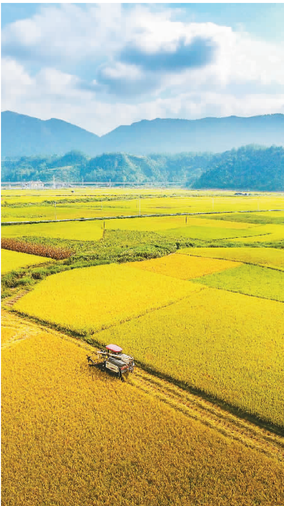
▲ 秋日的田野，千重稻浪，一片金黄。图为在湖南省湘西土家族苗族自治州龙山县，茅坪乡农民在稻田收割水稻。