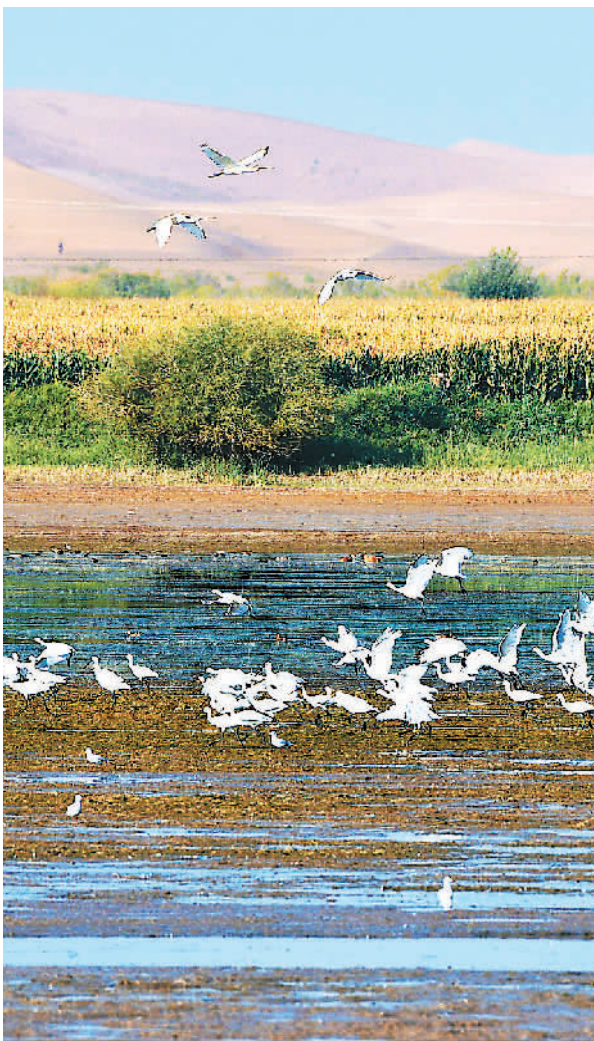
▼ 近日，甘肃张掖黑河湿地迎来了数万只南迁候鸟在此停歇觅食，蓝天与候鸟形成和谐相衬的壮美景观。