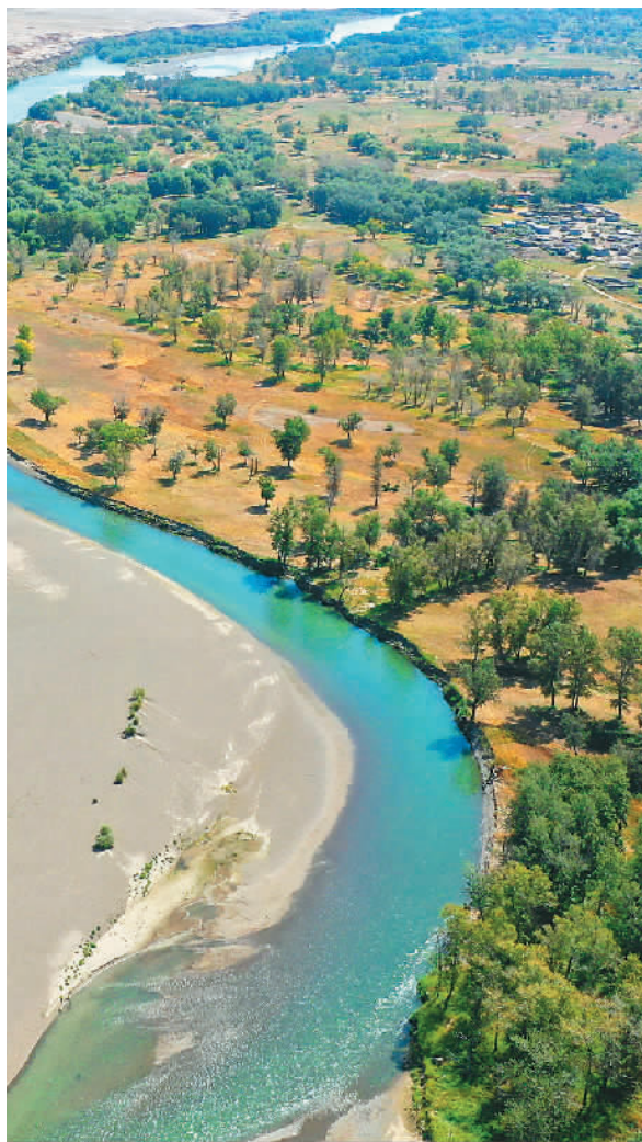
▼ 在新疆阿勒泰额尔齐斯河，翠绿色的河水，与两边森林地貌相依相伴相连，勾画出阿勒泰地区特有的自然风光。