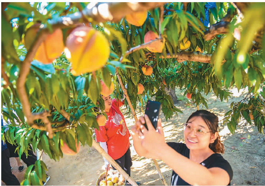
▲ 天气转凉，秋爽宜人，正是出游好时节。不少游客选择走进生态果园，体验采摘乐趣。图为在河北省深州市穆村乡马庄村御桃园蜜桃园，游客用手机拍摄蜜桃。