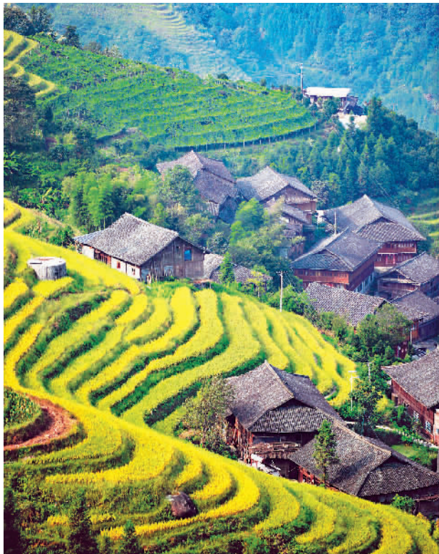
▲ 广西龙胜各族自治县泗水乡潘内村的金秋景象。