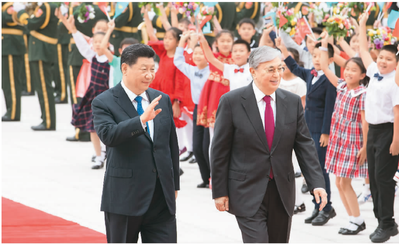
图为会谈前，习近平在人民大会堂东门外广场为托卡耶夫举行欢迎仪式。