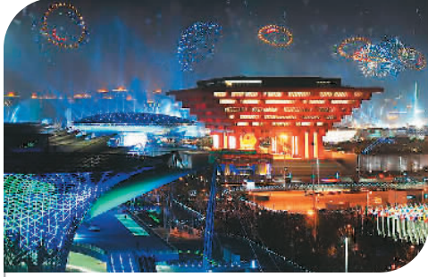
2010年5月1日至10月31日，第41届世界博览会在上海举行，共190个国家、56个国际组织参展。图为上海世博会开幕式上的烟花表演。