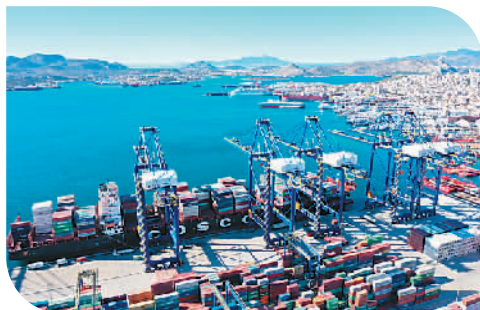
2013年，中国提出“一带一路”倡议。比雷埃夫斯港——希腊最大港口，在“一带一路”建设的推动下，成为全球发展最快的集装箱运输港。