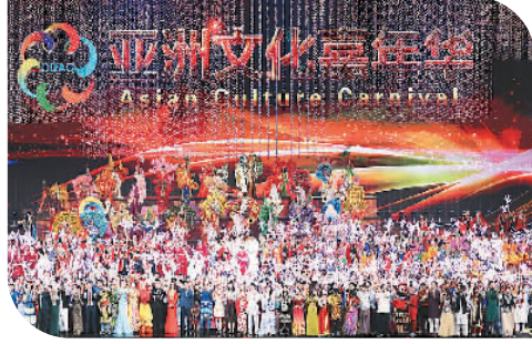
2019年5月15日至22日，亚洲文明对话大会在北京举行。图为5月15日，在北京“鸟巢”举行亚洲文化嘉年华活动。