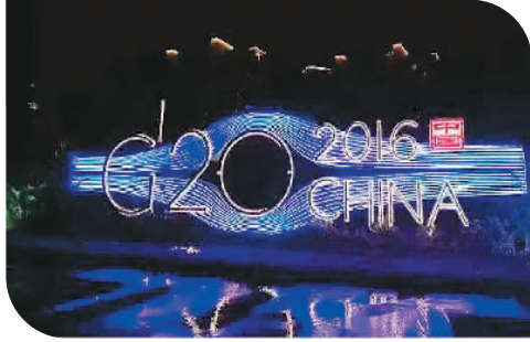
2016年9月4日，二十国集团领导人第十一次峰会在杭州国际博览中心举行。图为杭州西湖上G20标识的灯光秀。 资料照片