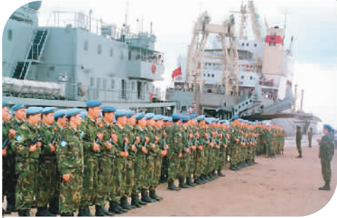
1992年4月24日，参加联合国维持和平行动的中国工程兵大队抵达柬埔寨磅逊港。图为中国工程兵大队在磅逊港集合。