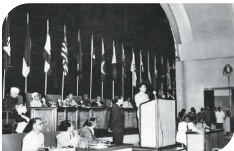
1955年4月18日至24日，亚非会议在印度尼西亚万隆召开，中国派代表团参会。图为周恩来总理在亚非会议上发表讲话。 资料照片