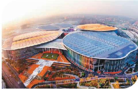
2018年11月5日至10日，首届中国国际进口博览会在国家会展中心（上海）举办。图为该国家会展中心外景。