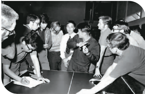
1971年，中美两国乒乓球队进行了一系列互访活动，推动了中美两国关系正常化的进程，被称为“乒乓外交”。图为中美两国乒乓球运动员在交流。 资料照片