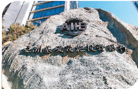
2016年1月16日，亚洲基础设施投资银行正式开业。图为位于北京金融街的亚投行总部大楼前的纪念碑。 资料照片