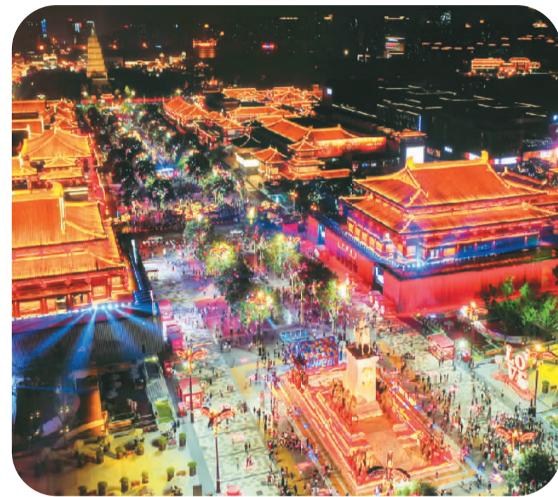
西安曲江大唐不夜城步行街成为西安夜经济的首选之地。

据了解，“北京旅游海外推广合作伙伴计划”自2018年开始实施，计划用3年时间招募100家海外知名旅行商成为官方合作伙伴，以海外合作伙伴为抓手，持续不断地拓展北京的外宣渠道、推广北京文化旅游资源，助力北京国际交往中心的建设。目前，加入该计划的海外合作伙伴已达60家。借助“合作伙伴计划”，北京市文化和旅游局除了加强对美国、日本、韩国、德国、英国、法国、新加坡、俄罗斯等主要客源国市场的开拓，也与阿联酋、泰国、马来西亚、波兰等“一带一路”沿线国家的旅游企业开展合作交流，开启“双向联动”模式，积极推动北京旅游产品在当地的推广。