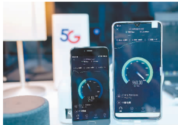
在2019中国国际智能产业博览会上的中国电信展厅内，一台5G手机（右）与一台4G手机（左）进行网络速度比较。

首先是信号问题。相对4G网络，5G频率高，单个基站覆盖面积小，使得站址密集程度远远超过4G网