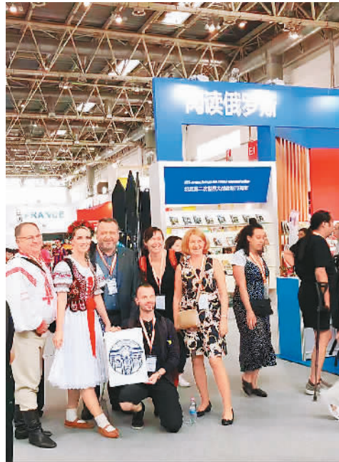
外国友人在俄罗斯展位前合影留念

通道左右的活动一个挨一个，嘉宾们专注谈论，完全无视周围的喧嚣。围绕新作《云中记》，阿来与30国汉学家进行了生动深刻的对话。阿来谈到对灵魂的理解以及为