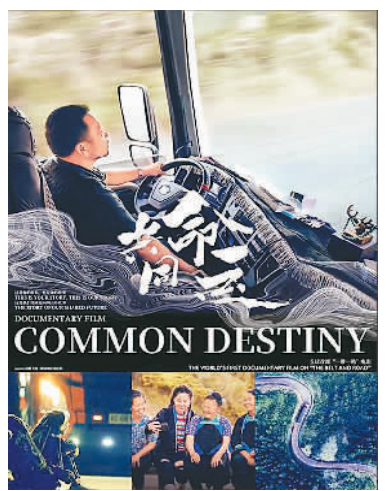
纪录电影《共同命运》

行程30万公里。影片展示了世界各地的壮阔风光，还通过普通人视角，解读中国与世界的休戚与共，命运相连。影片于8月30日在全国院线上映。