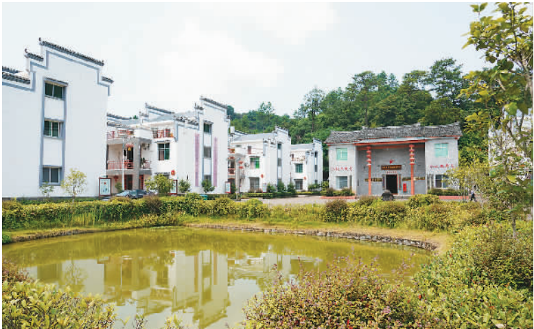
福寿沟与城内三大池塘和几十口小塘连为一体,有调蓄、养鱼、溉圃等综合功效。

据介绍,赣州章江新区的城市中央公园建设,借鉴了福寿沟的基础构造技术,将生态环境、景观环境与蓄洪排涝工程三者有机融合,利用自然条件建立了人工河塘,充分发挥着调洪蓄水的關鍵作用。