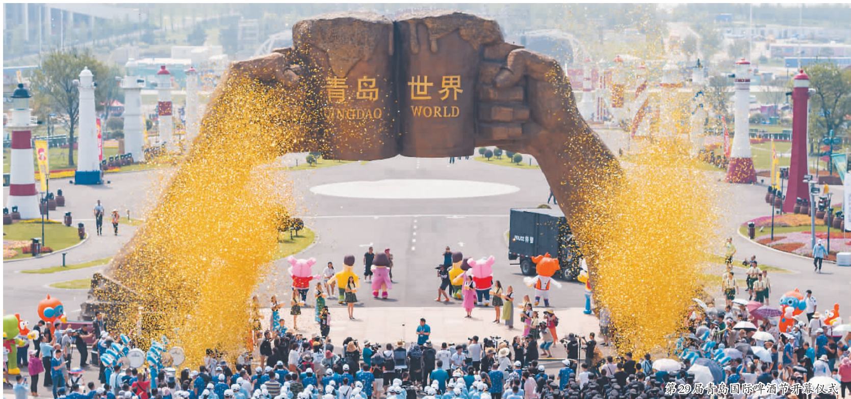
第29届青岛国际啤酒节开幕式