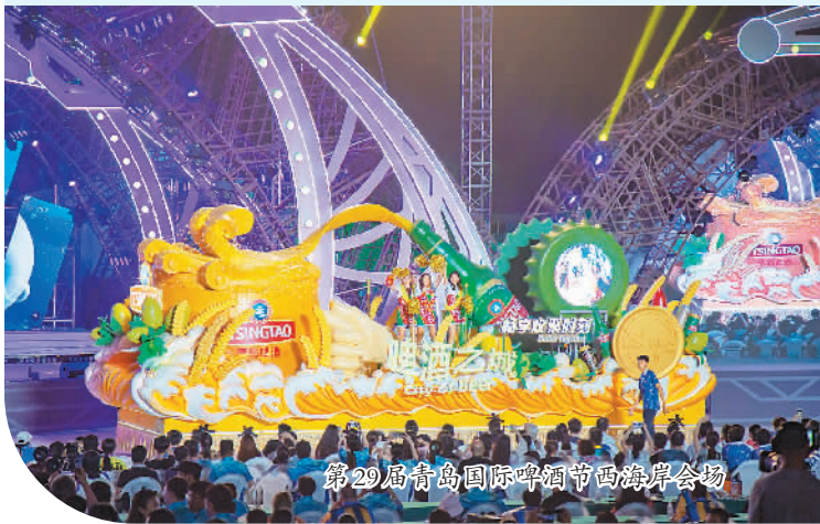
第29届青岛国际啤酒节西海岸会场

青岛国际啤酒节已经成为青岛的一张城市名片。开放、现代、活力、时尚的青岛正以啤酒节为媒介，打造啤酒产业、节庆旅游、国际合作激情碰撞的新舞台。