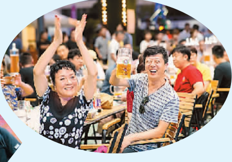
左图和上图为第29届青岛国际啤酒节上，海内外游客举杯欢聚