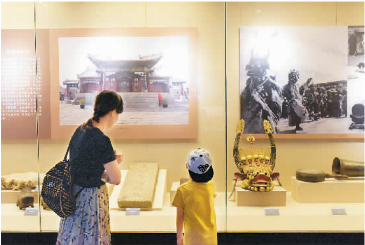
观众参观八省区万里茶道文物联展

7月30日，“世纪动脉——八省区万里茶道文物联展”在位于呼和浩特市的中国内蒙古博物院开展。展览展出万里茶道在中国境内经过的福建、江西、湖南、湖北、河南、山西、河北、内蒙古8个省区的相关文物遗产384件（套），其中不乏初次面世的茶道遗迹和重要文物图片，让观众感受万里茶道曾经创造的商业辉煌和文化底蕴，欣赏茶道及旅蒙商文化的独特魅力。