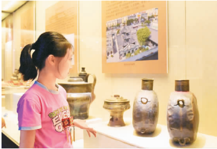
一名小朋友在欣赏文物“骆驼水壶”

7月30日，“世纪动脉——八省区万里茶道文物联展”在位于呼和浩特市的中国内蒙古博物院开展。展览展出万里茶道在中国境内经过的福建、江西、湖南、湖北、河南、山西、河北、内蒙古8个省区的相关文物遗产384件（套），其中不乏初次面世的茶道遗迹和重要文物图片，让观众感受万里茶道曾经创造的商业辉煌和文化底蕴，欣赏茶道及旅蒙商文化的独特魅力。