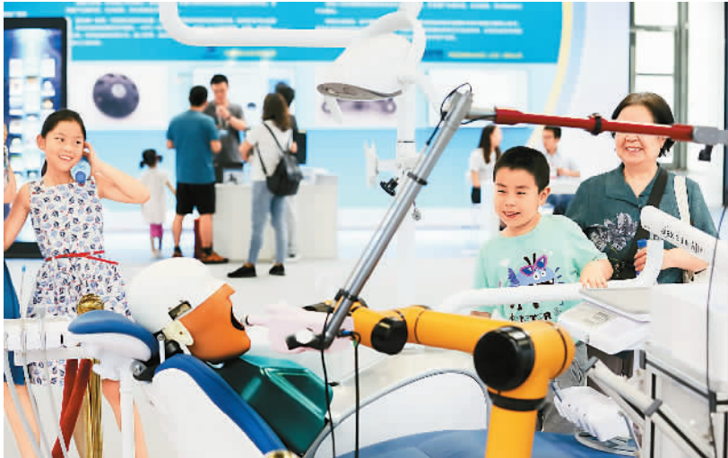
6月15日，在北京中关村举行的全国大众创业万众创新活动周上，家长带着孩子参观口腔临床微机器人手术系统。