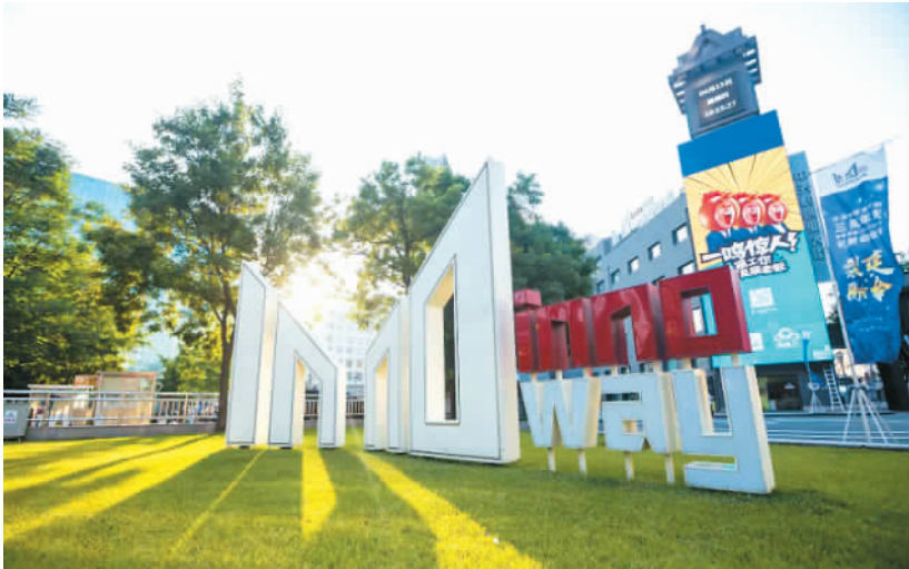
8月1日，北京市海淀区的中关村创业大街，阳光明媚，天气晴好。创业大街的主形象标志在阳光下清新美丽，吸引游人观看。（资料图片）