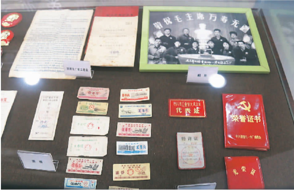
“816”地下核工程相关展品

1966年，正是三线建设全面拉开帷幕的第二年，中央批准建设“816”工程。“好人好马上三线”，为了国家绝密的核事业，数万建设者拖家带口，一头扎进了涪陵的小山沟里。