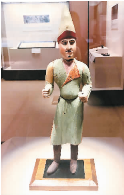
唐代彩绘骆驼夫俑

一幅唐代彩绘伏羲女娲绢画，左为发束高髻的女娲，右手执规，右为头戴网帟的伏羲，左手执带墨斗的矩尺，二人上身相拥，两尾相交，画面四方绘有日月星辰。这幅具有中原文化特色的绢画，出土于新疆吐鲁番阿斯塔那墓地，曾在《国家宝藏》第二季中亮相。有意思的是，画中的伏羲女娲皆为胡人面相，中原和西域文化的交融，在这幅画上体现得淋漓尽致。