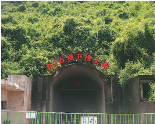
“816”地下核工程景区入口

从重庆涪陵下高速，秀美的乌江山水一路蜿蜒。驱车两个小时后，路旁一栋老式红砖小楼跃入眼帘，这就是“816”景区接待中心。从地下通道走到马路对面，只见青山脚下有个水泥洞口，上面几个红色大字格外醒目：“816地下核工程”。