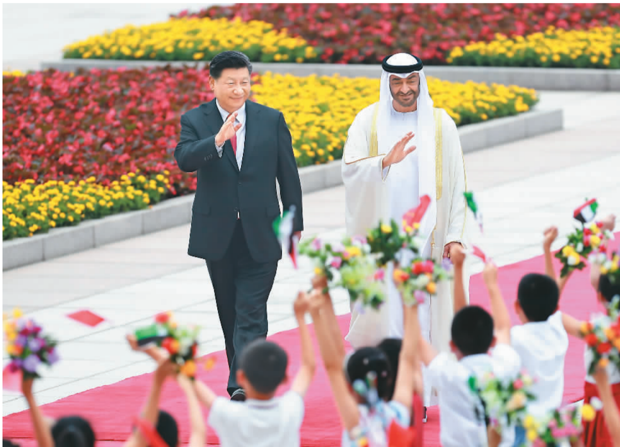
图为会谈前, 习近平在人民大会堂东门外广场为穆罕默德举行欢迎仪式。