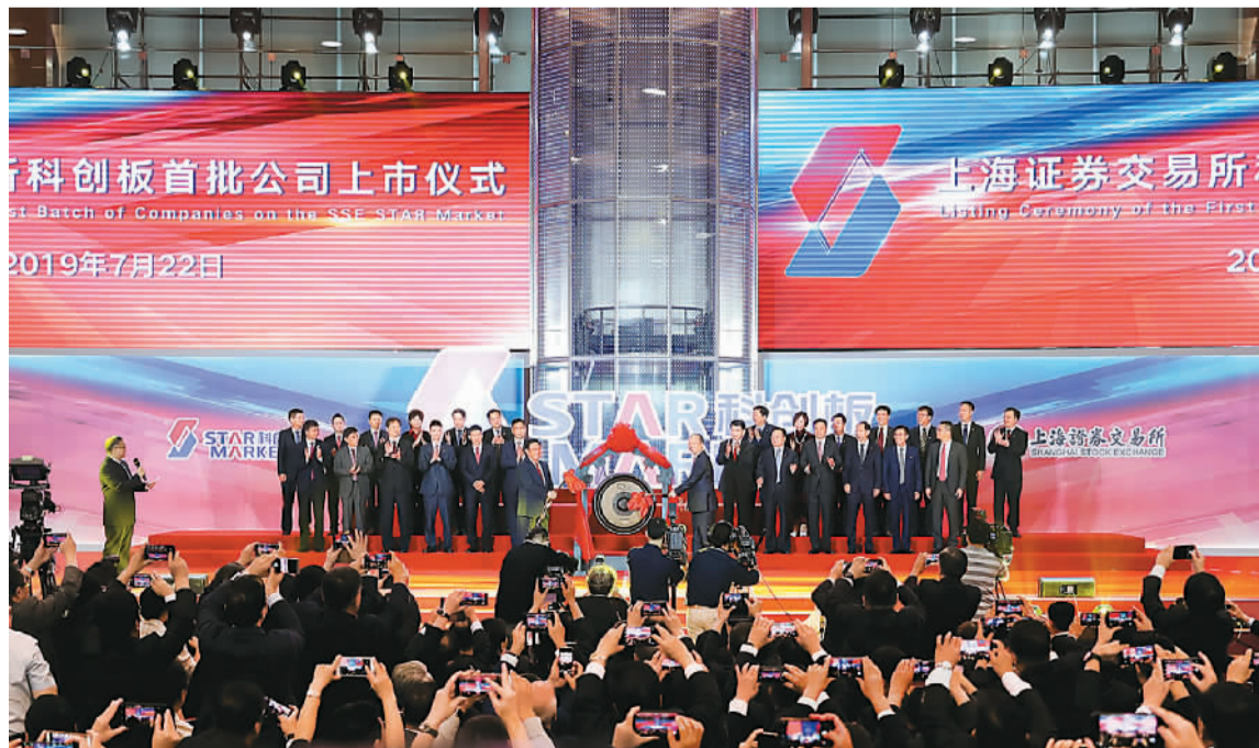
7月22日, 科创板首批公司在上海证券交易所举行上市仪式。