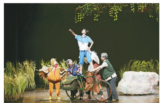
▲剧中的儿童、老人与妈妈

此外，《月亮上的妈妈》还巧妙利用木偶、剪纸等“非遗”艺术营造“戏中戏”讲故事，现场乐队及合唱队浑然一体地植入广西特有的彩调、渔鼓、零零落等民族音乐元素，为观众奉献了一场极富中国西南民族艺术特色的视听盛宴。据悉，儿童音乐剧《月亮上的妈妈》接下来将赴广州、中山、北海、崇左等地开展30场全国巡演。