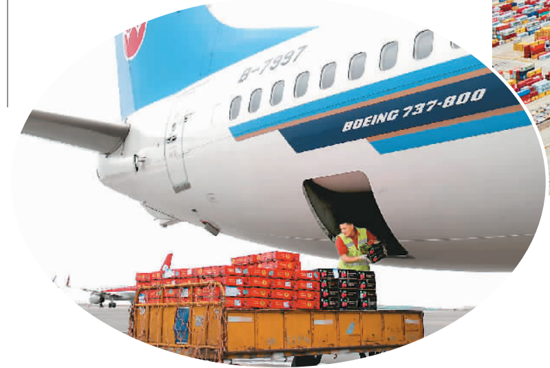
左图：工作人员在乌鲁木齐地窝堡国际机场卸运从吉尔吉斯斯坦进口的樱桃。入夏以来，产自吉尔吉斯斯坦、塔吉克斯坦等中亚邻国的樱桃凭借便捷的空中通道，“乘机”走俏我国水果市场。