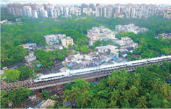
图为6月30日，海南环岛高铁一列车经过琼海市（无人机拍摄）。