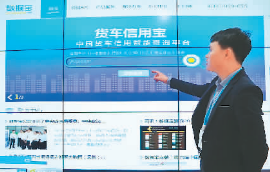
图为贵州数据宝网络科技有限公司工作人员在展示他们制作的货车信用查询平台。