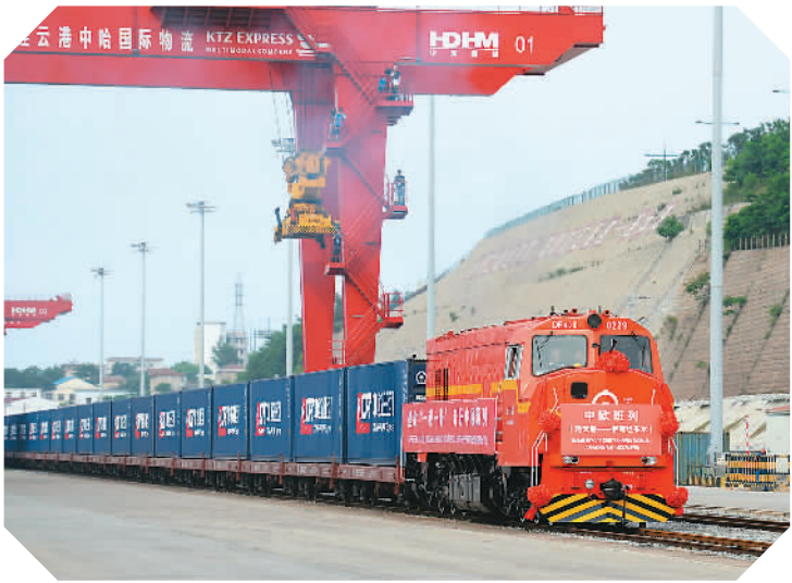
图为由江苏连云港开往土耳其伊斯坦布尔的中欧班列驶出中哈连云港物流合作基地。