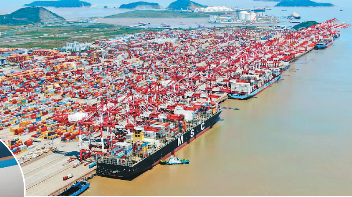
上图：全球最大的全自动化集装箱码头“上海洋山深水港四期”码头。据海关统计，今年前5个月我国货物贸易进出口总值12.1万亿元人民币，比去年同期增长4.1%。

开放已经成为当代中国的鲜明标识。近日，中国再次频频扩大开放的积极信号，并且相继出台相关举措，让世界看到，中国扩大开放不空喊口号，也不开“空头支票”。对此，各大外媒纷纷关注点赞。