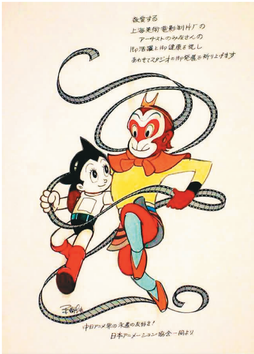
▲手塚治虫赠予上海美影厂的《孙悟空与阿童木》 资料图片

“中国动漫日本行——从水墨中来”系列展览是大阪G20峰会前期重要的文化交流活动之一，由中国国务院新闻办公室、中国国家广播电视总局、中国驻日本国大使馆联合主办。本次展览是中国动漫第一次以“国家队”名义大规模在日本展出，从中国动漫的历史回顾出发，以中国动漫蓬勃发展的为主线，中日动漫交流合作情况为重要内容，全方位展示新中国成立以来，尤其是中共十八大以来中国动漫艺术创作的全景。