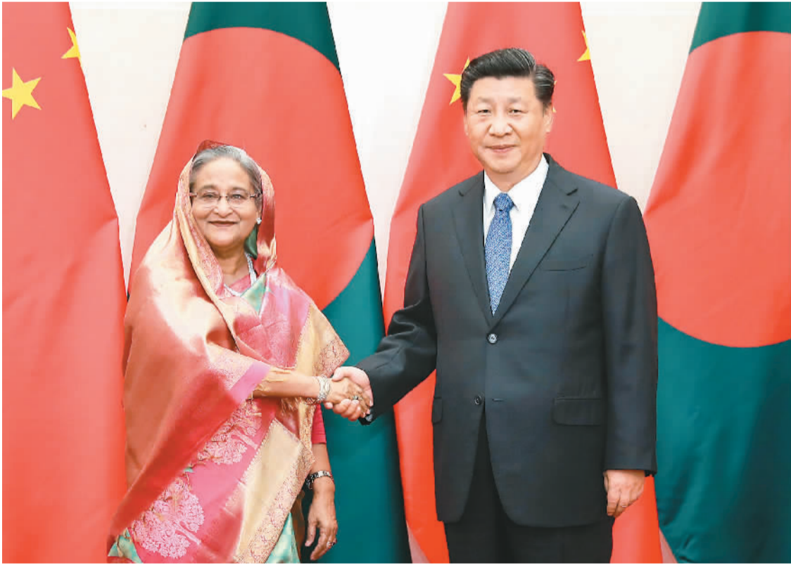
七月五日，国家主席习近平在北京钓鱼台国宾馆会见孟加拉国总理哈西娜。