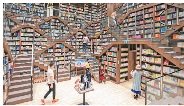
市民和游客在重庆钟书阁书店内拍照。该书店“山形阶梯”的装修风格融入了山城的地势特色，镜面天花板上倒映着层层环绕的阶梯，让人眼前一亮。