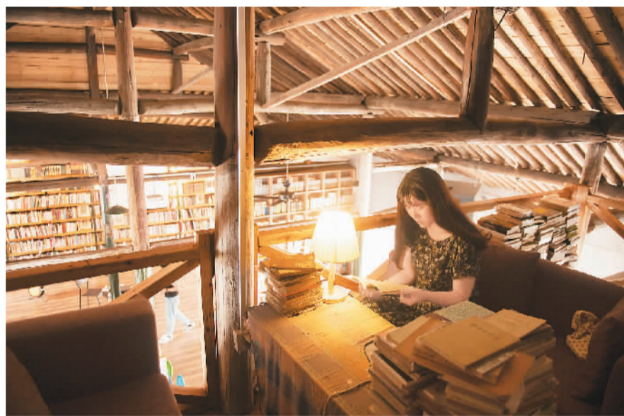
一位读者在浙江省绍兴市一栋闲置老楼改造成的“荒原书店”中读书。这家颇有设计感的独立书店不定期举办音乐演出、艺术展览、文化沙龙、电影观摩等活动，成为宁静古城的一处文化地标。