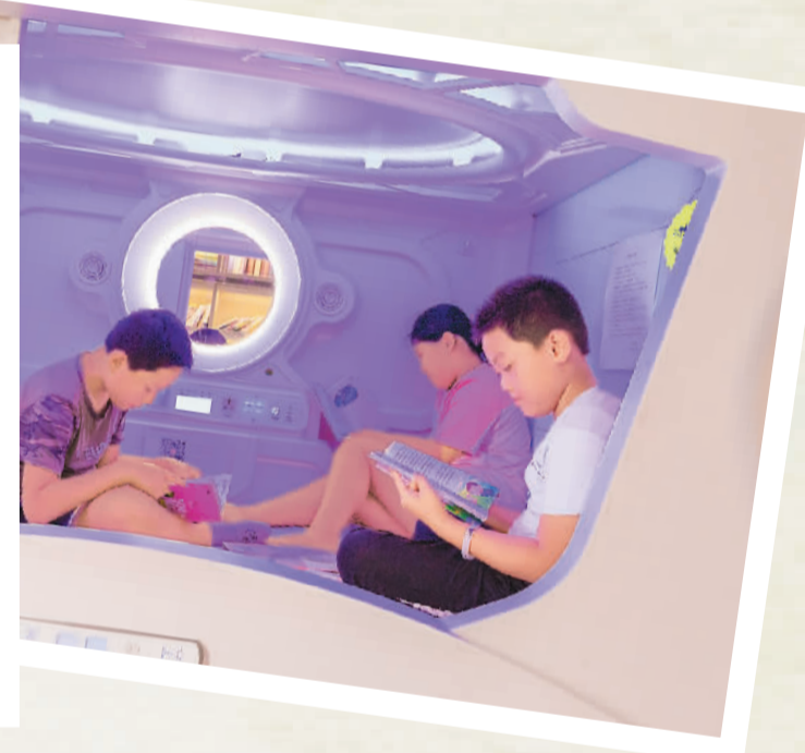
读者在内蒙古自治区呼和浩特市玉泉区如斯公益书吧内的太空舱里读书。