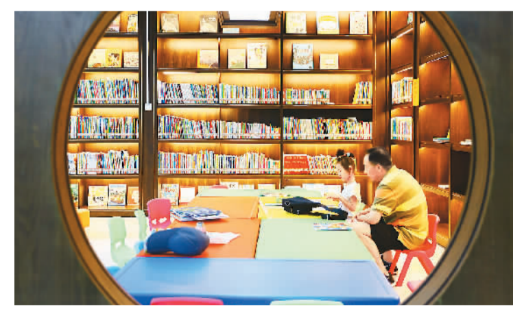
在安徽合肥的城市阅读空间青秀书城内，孩子在长辈陪伴下翻阅书籍。