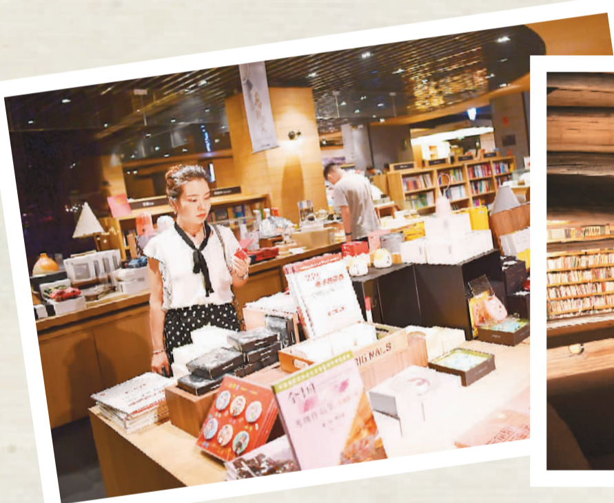
读者在陕西省西安市曲江书城内选购文创产品。