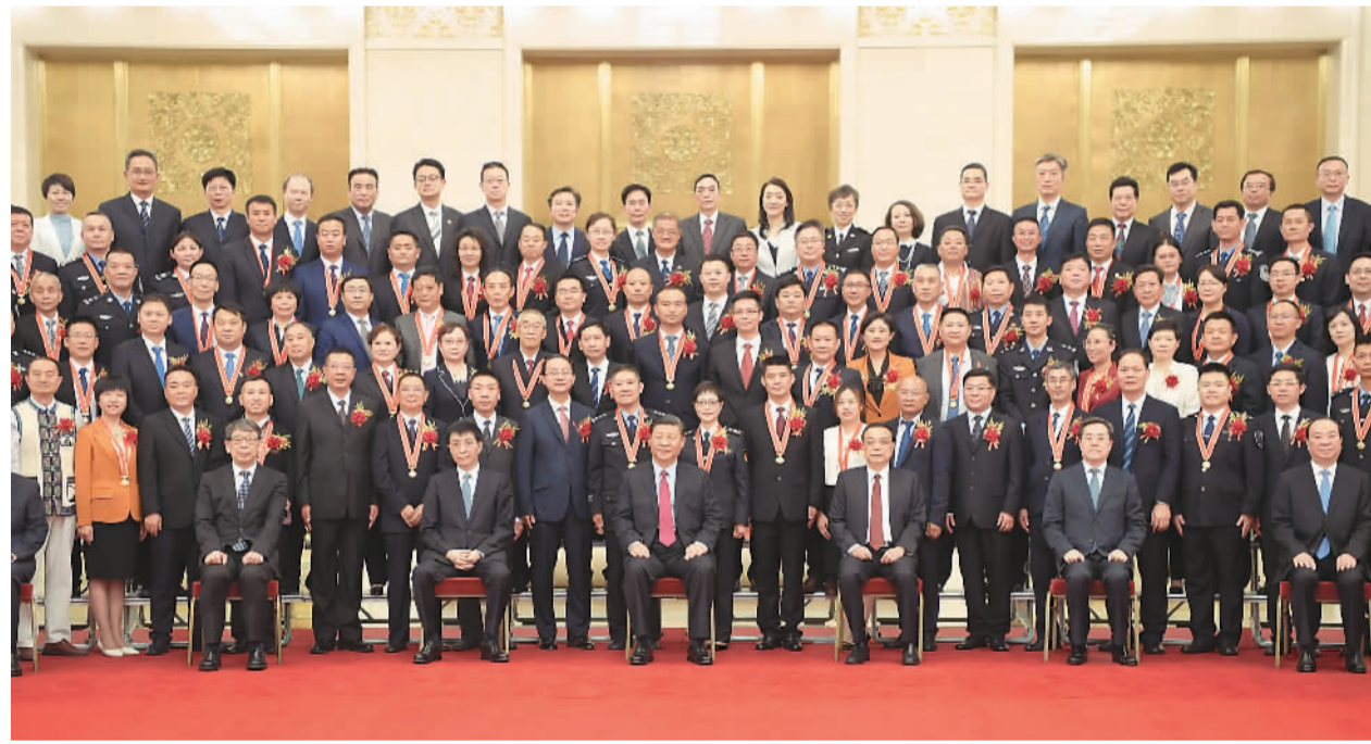
6月25日，党和国家领导人习近平、李克强、王沪宁等在北京人民大会堂会见第九届全国“人民满意的公务员”和“人民满意的公务员集体”受表彰代表。