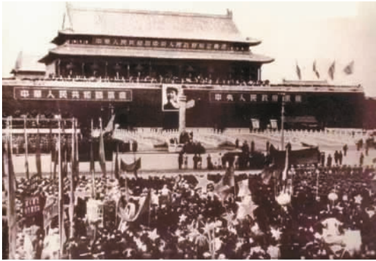
中华人民共和国成立典礼现场

将工作重心从农村转向城市，不是件容易的事情。在七届二中全会上，毛泽东说，中央领导的正确，就是综合了各地供给的材料、报告和正确的意见。如果各地不来