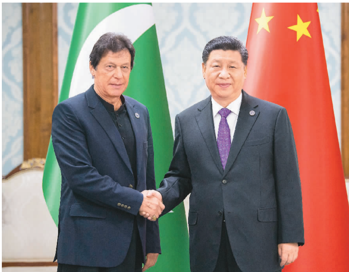
六月十四日，国家主席习近平在比什凯克会见巴基斯坦总理伊姆兰·汗。

本报比什凯克6月14日电（记者裴江、屈佩）国家主席习近平14日在比什凯克会见巴基斯坦总理伊姆兰·汗。习近平指出，过去8个月里，我和总理先生3次会见。这充分体现了中巴全天候战略合作伙伴关系的高水平。在复杂的国际和地区形势下，中国和巴基斯坦要开展更加紧密的协调合作，打造更加紧密的中巴命运共同体。