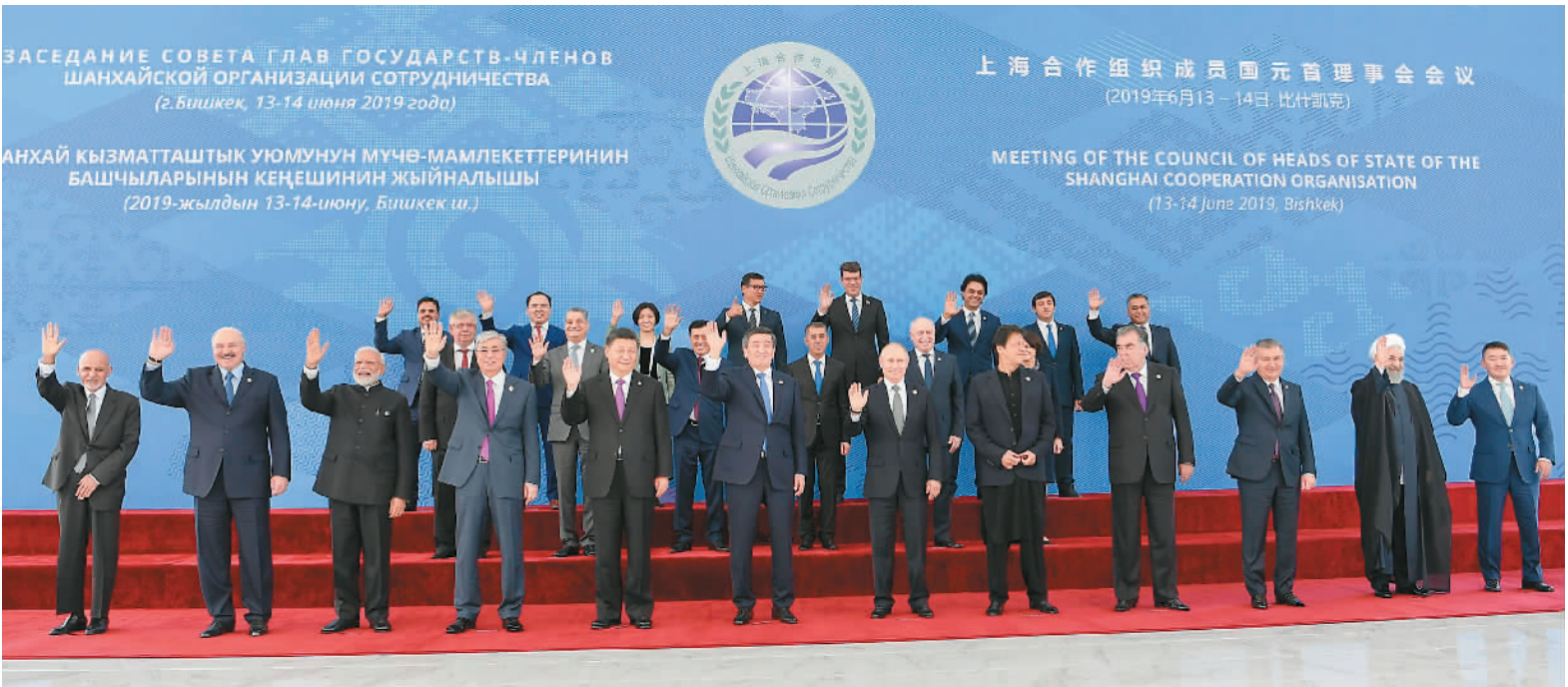
6月14日,上海合作组织成员国元首理事会第十九次会议在吉尔吉斯斯坦首都比什凯克举行。国家主席习近平同印度总理莫迪、哈萨克斯坦总统托卡耶夫、吉尔吉斯斯坦总统热恩别科夫、巴基斯坦总理伊姆兰·汗、俄罗斯总统普京、塔吉克斯坦总统拉赫蒙、乌兹别克斯坦总统米尔济约耶夫出席会议。习近平在会上发表重要讲话。图为大范围会谈后,与会各方集体合影。

结合中获取力量,携手构建更加紧密的上海合作组织命运共同体。 第一,我们要把上海合作组织打造成团结互信的典范。要坚持将“上海精神”作为本组织核心价值 and 共同理念,恪守上海合作组织宪章、长期睦邻友好合作条约确立的宗旨和原则,增进政治互信,加大相互支持,扩大利益汇合点。 第二,我们要把上海合作组织打造成安危共担的典范。要秉持共同、综合、合作、可持续的安全观,多措并举打击“三股势力”,加强去极端化合作。要为阿富汗早日实现和平、和解、稳定、发展发挥建设性作用。 第三,我们要把上海合作组织打造成互利共赢的典范。要倡导维护多边贸易体制、构建开放型世界经济,推动在贸易和投资自由化便利化方面作出更多制度性安排,用好中国国际进口博览会等合作共享平台,促进区域经 济进一步开放、交流、融合。要认真落实第二届“一带一路”国际合作高峰论坛成果,推动共建“一带一路”倡议同各国发展战略及欧亚经济联盟等区域合作倡议深入对接,着力构建全方位互联互通格局。要坚持创新驱动发展,在数字经济、电子商务、人工智能、大数据等领域培育合作增长点。 第四,我们要把上海合作组织打造成包容互鉴的典范。要摒弃文明冲突,坚持开放包容、互学互鉴。要不断深化文化、教育、旅游、体育、媒体、地方等领域合作,不断提升民众参与度和获得感。 习近平强调,面对日益增多的全球性挑战,我们要展现应有的国际担当,坚持共商共建共享的全球治理观,维护以联合国为核心的国际体系,促进多边主义和自由贸易,推动国际秩序朝着更加公正合理方向发展。上海合作组织要完善伙伴关系布局,在国际和地区事务中发挥更加积极作用,共同致力于促进世界持久和平和共同繁荣。让我们秉持“上海精神”,凝心聚力,务实笃行,共同创造上海合作组织更加美好的明天。(讲话全文见第二版) 与会领导人重申坚持多边主义,恪守联合国宪章宗旨和原则,致力于在国际法基础上建设新型国际关系并确立构建人类命运共同体的理念,同意努力提升上海合作组织在国际和地区事务中的作用。 许多领导人高度评价共建“一带一路”取得的进展,重申支持“一带一路”倡议与各国发展战略对接。主张深化贸易、金融、投资、交通、能源、农业、创新、高技术、人文等领域务实合作,推动贸易和投资便利化,促进地区一体化进程,共同构建开放型世界经济,维护世界贸易组织权威和效力,反对任何形式的单边主义和保护主义行为。 领导人强调,要共同维护上海合作组织地区安全稳定和可持续发展,坚定打击国际恐怖主义、分裂主义、跨国组织犯罪等,共同应对毒品威胁。阿富汗问题涉及地区安全,上海合作组织有必要为阿富汗问题的政治解决发挥更重要作用。 会议决定,上海合作组织成员国元首理事会下次会议在俄罗斯举行。下任主席国由俄罗斯担任。 成员国领导人签署《上海合作组织成员国元首理事会比什凯克宣言》以及关于信息通信技术、禁毒、地方合作等13个合作文件。 会议发表了《上海合作组织成员国元首理事会会议新闻公报》。 会议后,习近平出席热恩别科夫为出席会议的各国领导人以及国际和地区组织负责人举行的欢迎宴会。 丁薛祥、杨洁篪、王毅、何立峰等参加有关活动。