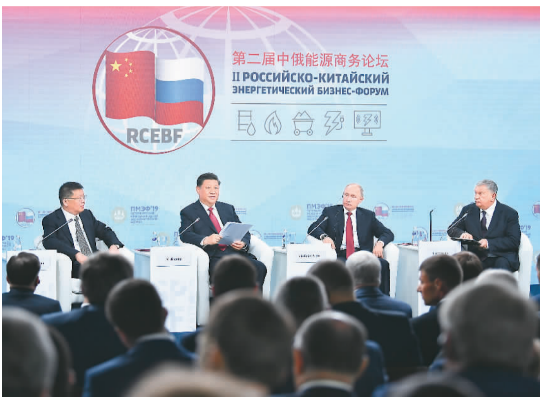
六月七日, 国家主席习近平在圣彼得堡同俄罗斯总统普京一道出席中俄能源商务论坛。