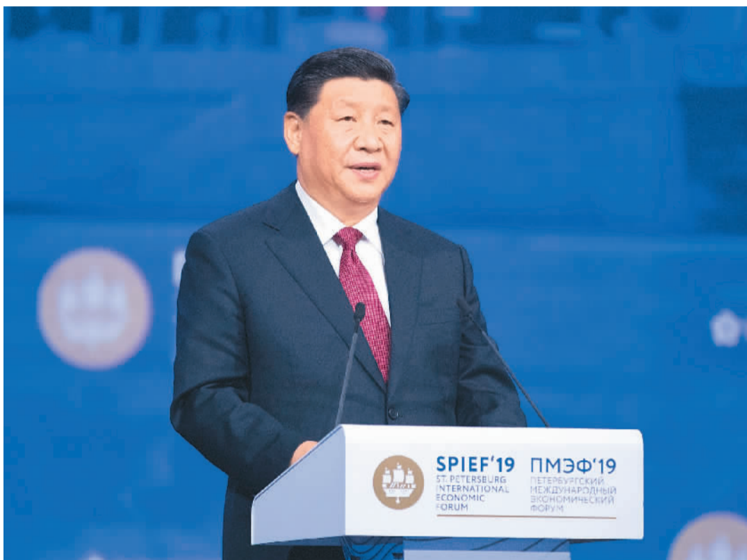
六月七日, 第二十三届圣彼得堡国际经济论坛全会在圣彼得堡举行。中国国家主席习近平、俄罗斯总统普京、保加利亚总统拉德夫、亚美尼亚总理帕希尼扬、斯洛伐克总理佩列格里尼、联合国秘书长古特雷斯等出席。图为习近平发表题为《坚持可持续发展 共创繁荣美好世界》的致辞。