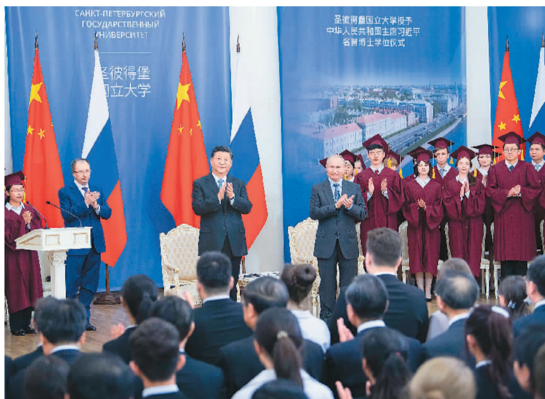
六月六日, 国家主席习近平在圣彼得堡出席接受圣彼得堡国立大学名誉博士学位仪式。俄罗斯总统普京出席仪式。

习近平强调,中俄能源合作空间广阔,潜力巨大。我愿同普京总统一道,引领和推动两国政府为两国企业扩大合作创造更加良好的营商环境,提供更加全面的政策支持。(下转第三版)