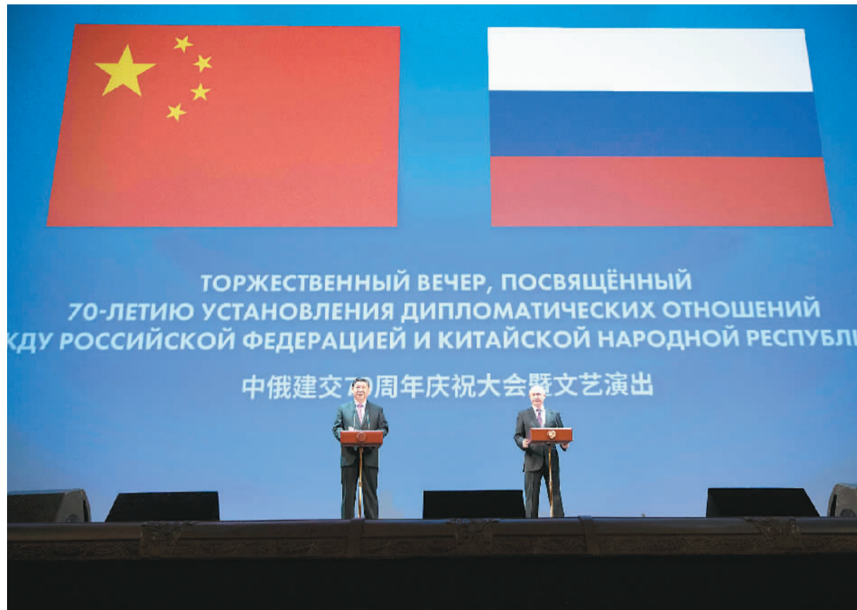
6月5日, 国家主席习近平和俄罗斯总统普京在莫斯科大剧院共同出席中俄建交70周年纪念活动。