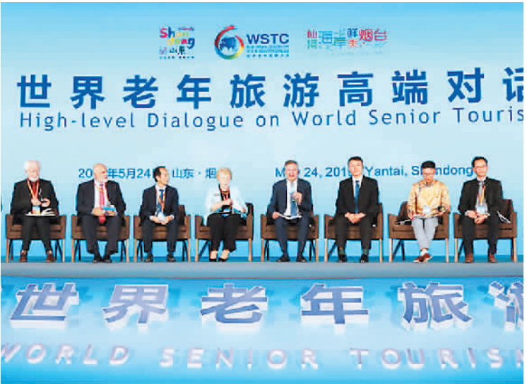
有关专家就老年旅游相关话题展开讨论。