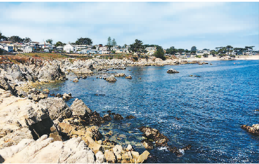
加利福尼亚州蒙特利湾，广东渔民横渡太平洋曾到达此处。

的地方，全境无一寸荒地”，“沿河两岸皆是花园、村落和田禾”。他的《伊本·白图泰游记》中写到泉州和广州制造的大船，“有十帆，至少是三帆。帆是用藤篾编织的，其状如席”，大船上有水手600名，战士400名。“船上造有甲板四层……官舱的住室附有厕所，并有门锁”，“在木槽中种植蔬菜鲜姜”。