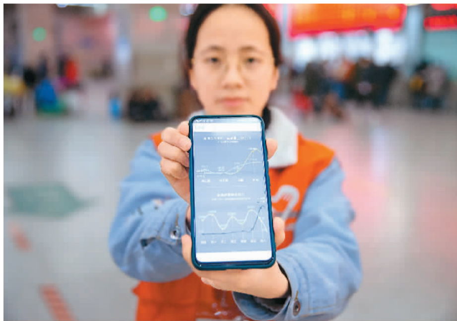
志愿者小宁正在展示自己手机的计步数据。

其实，关于手机定位可能会泄露用户隐私的事件并不新鲜，有些不只是关系到个人用户，甚至会威胁到国家利益。比