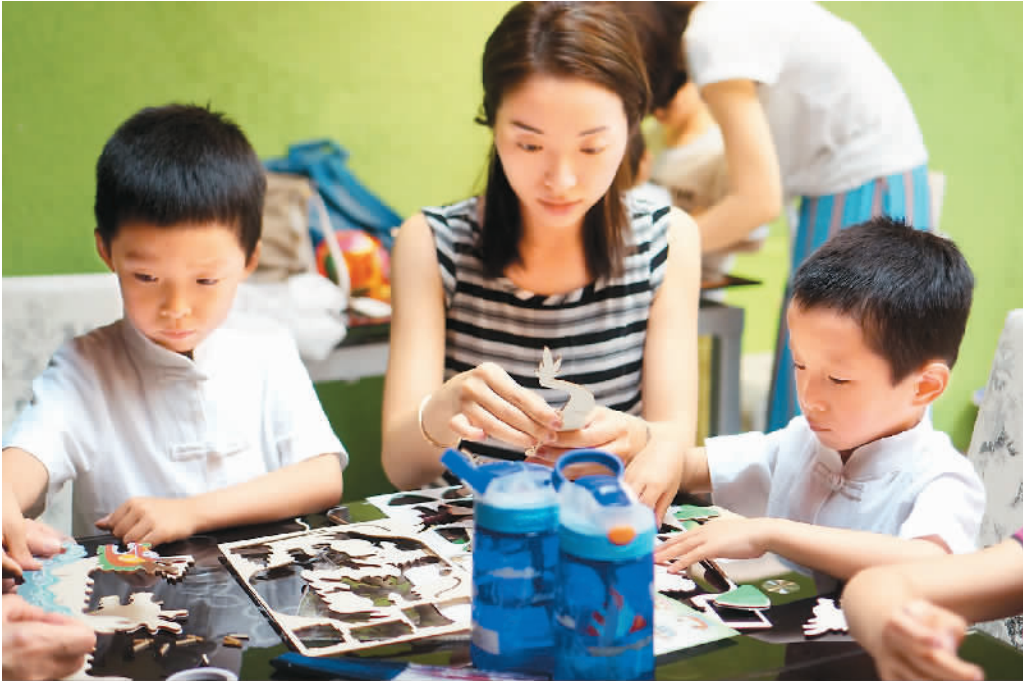
德国文德书院的实景课堂上,孩子们跟随老师一起做龙舟。

近日,由中国华文教育基金会主办的华文教育互联网教学研讨会在北京召开,会议以“智慧教育推动全球华文学校改革与创新”为主题,吸引了来自五大洲20个国家的53名代表参会。 这是全球范围内华文教育领域首次召开的“互联网+华文教育”主题会议,为华文教育提供了新的发展路径。