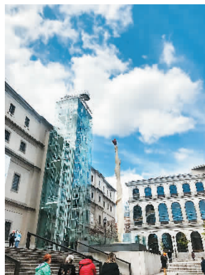
索菲亚王后国家艺术中心