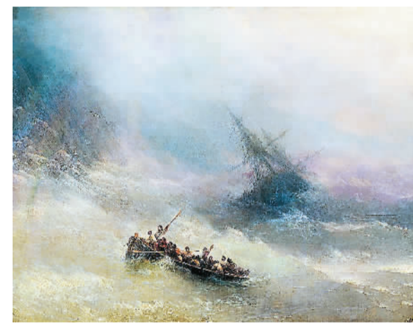
特列季亚科夫画廊展出的伊凡·艾瓦佐夫斯基的《彩虹》。

西班牙是一个被艺术包裹的国家，从文艺复兴后期的画家委拉斯凯兹到开启现代艺术大门的戈雅，再到上世纪叱咤风云的毕加索……无数大师从这里走向世界。