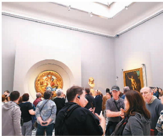
意大利乌菲兹美术馆内的参观者。

上周，我参观了意大利乌菲兹美术馆，当天排了两个多小时终于入馆。排队时，我身旁站着一位优雅的拉脱维亚女郎，正手捧着相机拍摄。她问我：“你想来看谁的画？”我脱口而出：“当然是波提切利”。她和我相视一笑，原来也是想看波提切利的作品。我们一边排队、一边聊天。“在欧洲，人和博物馆是一体的。”她说。