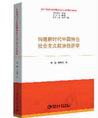
蔡昉 张晓晶著 商务印书馆

国新思想”，重点把握习近平治国理政新思想；五是“全球新方案”，展示中国发展道路作为可供选择的新的现代化模式是中国对世界的贡献。