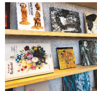
朝阳城市书屋·春风习习馆陈列的图书