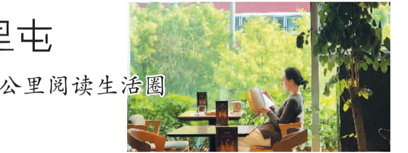
言几又店阅读桌正对满目苍翠

有人发出感叹：“我还是喜欢这里的书。”店内以三联版文学、艺术、学术、文化、生活图书板块为主，精选优质图书2.5万种，文化人到这里，都会忍不住买几本。店内设计高低错落，加上咖啡休息区，保证了顾客阅读、会友、休憩的需要，日均客流量达3000余人次，周末达5000余人次。