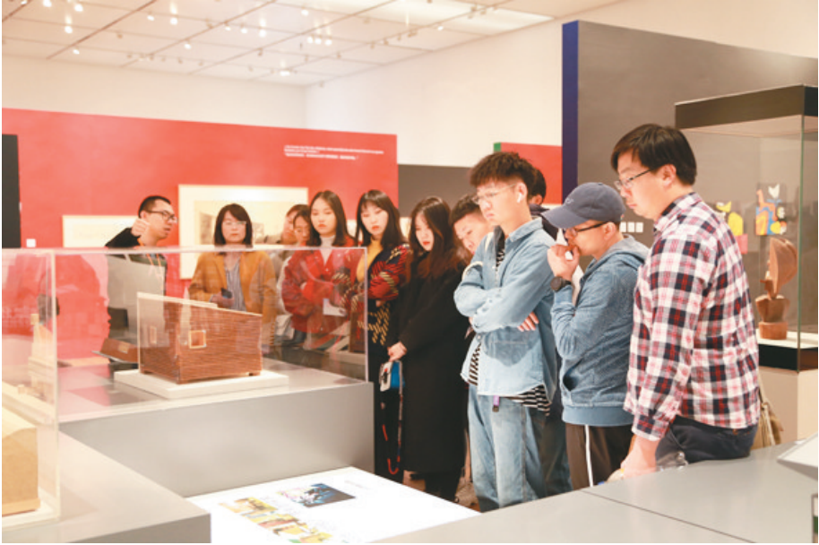
观众参观展览

去年天津美术馆又举办了“百年流变——历史视野下的天津当代艺术足迹”文献展览，是对天津美术馆“百年流变——天津近现代美术发展历程展”