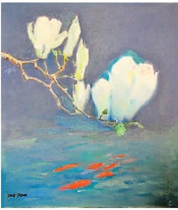
秦征《玉兰锦鲤》，天津美术馆藏