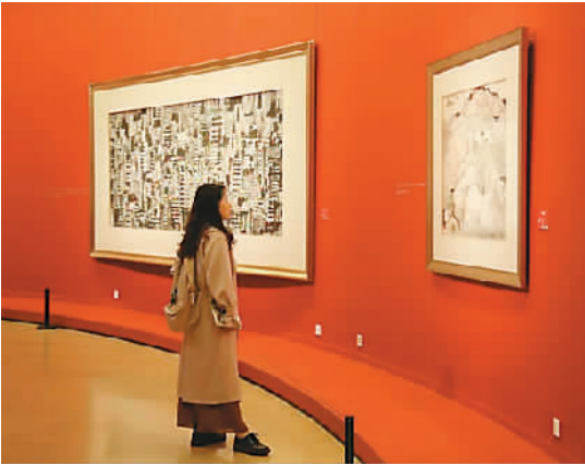
“风筝不断线”展览现场

据了解，吴冠中生前曾在中国美术馆举办过4次个人展览：1979年“吴冠中绘画作品展”；1985年“吴冠中新作展”；1999年“吴冠中艺术展”；2009年“耕耘与奉献——吴冠中捐赠作品展”。其中，1999年吴冠中向中国美术馆无偿捐赠了10件作品；2009年再次向中国美术馆无偿捐赠了36件作品，使中国美术馆收藏了吴冠中各个时期的代表性画作共62件，极大丰富了中国美术馆关于中国现代美术作品收藏的序列。2010年吴冠中去世后，为了纪念吴冠中对对中国美术馆收藏事业发展的贡献，中国美术馆主办了“不负丹青——吴冠中纪念特展”。