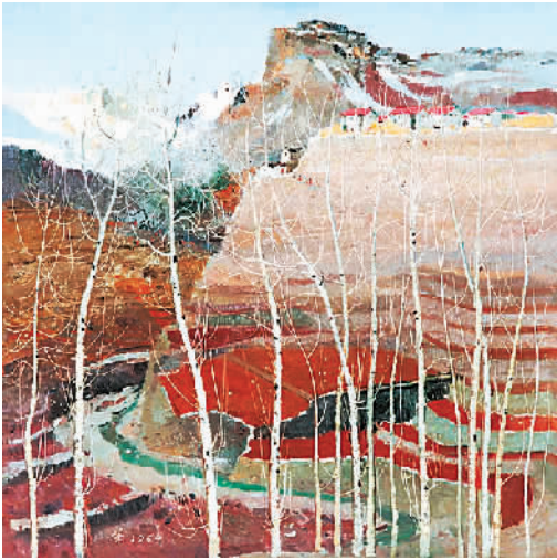
吴冠中《山村晴雪》，中国美术馆藏

吴冠中一直强调“风筝不断线”，就是艺术创作不能远离现实生活，在抽象艺术探索的过程中，要注意不能完全抽象。造化与心源、物象与心象，经由他那颗纯真之心的提炼与升华，成为永恒的艺术之美。