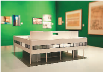
展览现场