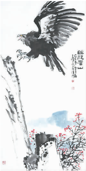
孙其峰《睥视群山》，天津美术馆藏

的延续。展览梳理了上世纪80年代以来在天津当代美术史历程中的重大事件与代表人物，为本土当代艺术的表达方式开启了新的思路 and 方向。