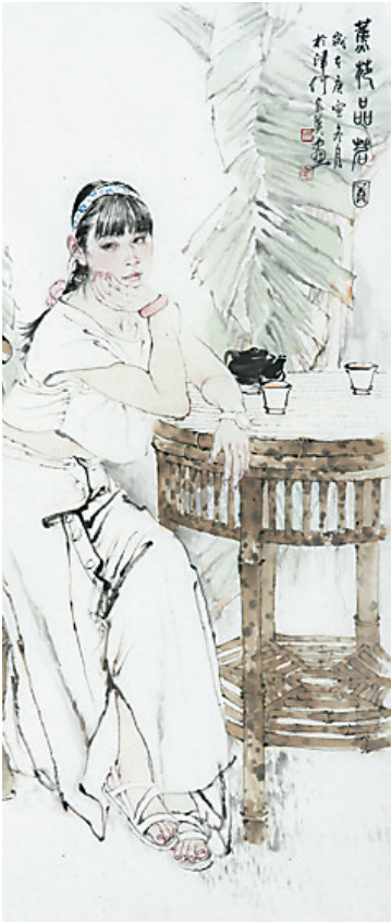
何家英《蕉苑品茗图》，天津美术馆藏