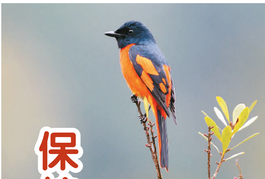
九连山的赤红山椒鸟。