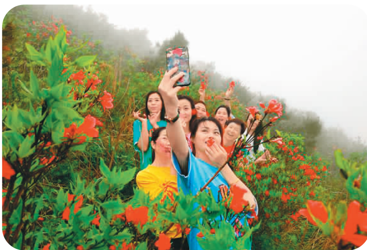
湖南省靖州苗族侗族自治县靛青山自然保护区，满山遍岭的杜鹃花竞相开放，吸引了不少游客前来观赏。