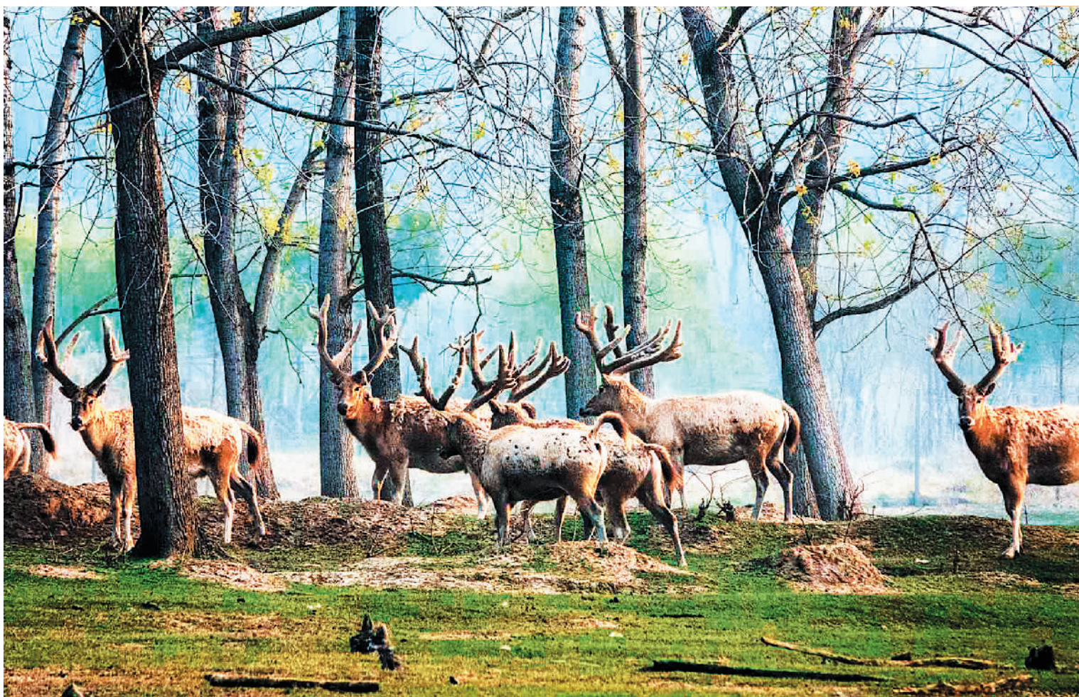
麋鹿在江苏大丰麋鹿国家级自然保护区内幸福生活着。

我国的喀斯特地貌是世界上最大最壮观的热带至亚热带喀斯特地貌样本之一，云南石林、贵州荔波、重庆武隆、广西桂林、贵州施秉、重庆金佛山和广西环江等地都有着这样的地貌，是中国乃至世界的自然遗产。