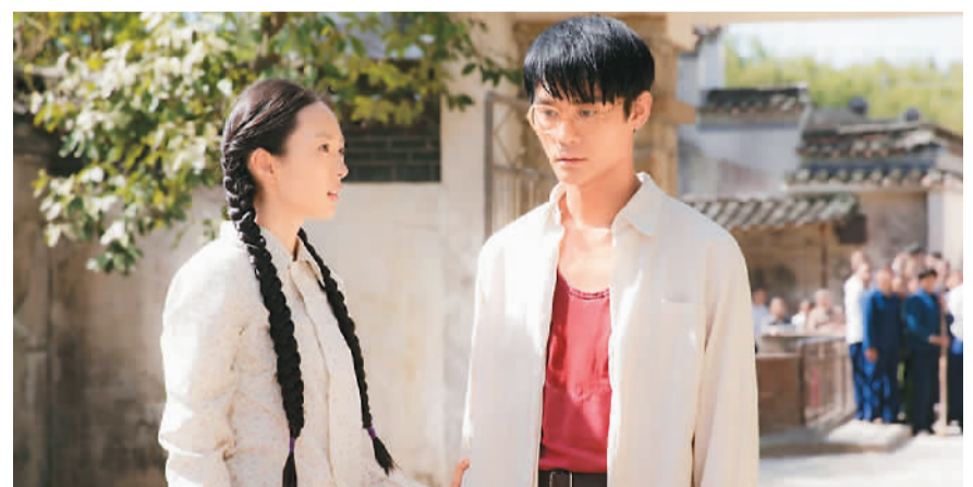
电视剧《大江大河》剧照

在很多备受好评的国产网红剧中，演员的敬业表现成为人们关注的焦点。在《大江大河》中，男主角衣服上奔跑造成的汗渍因细节真实成为观众热议的话题，其背后折射出观众日趋增高的观剧水平和对高质量制作影视剧的巨大需求。这对影视剧市场的良性发展无疑是一种强大的正向推动，要求制作方拿出