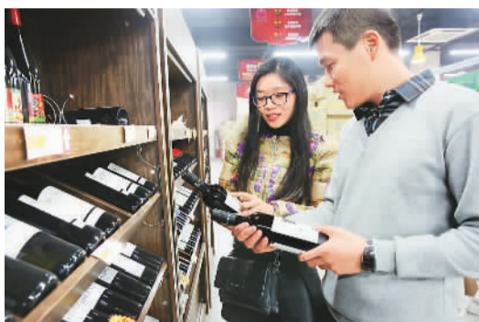
顾客在青岛保税港区启纪进口商品直营中心选购进口红酒。

经过三年的探索，青岛已成为北方唯一覆盖“网购保税进口”“直购进口”“一般出口”和“特殊区域出口”四种监管模式的城市。