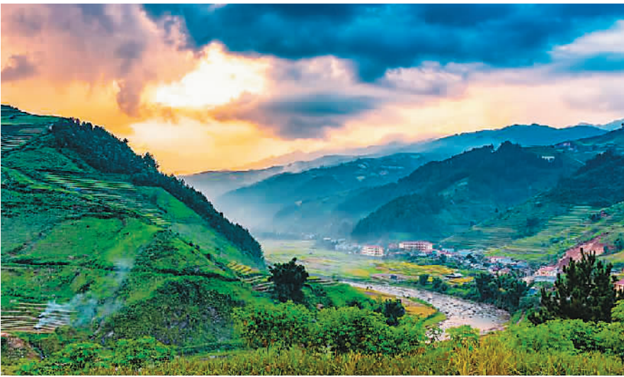
桐庐风光

特别倾倒，他的“潇洒桐庐郡十绝”第六咏就是茶：“潇洒桐庐郡，春山半是茶。新雷还好事，惊起雨前芽。”在北宋，桐庐茶已经很有名了，“宋时以贡贡”，宋朝皇帝也喝桐庐茶。可以肯定的是，桐庐茶在当时已经有相当的交易规模了，否则不会“春山半是茶”。就茶的品质来说，人们都比较偏爱明前茶雨前茶，这同样也说明，饮茶之风已盛，大家喝茶都比较讲究品质了。