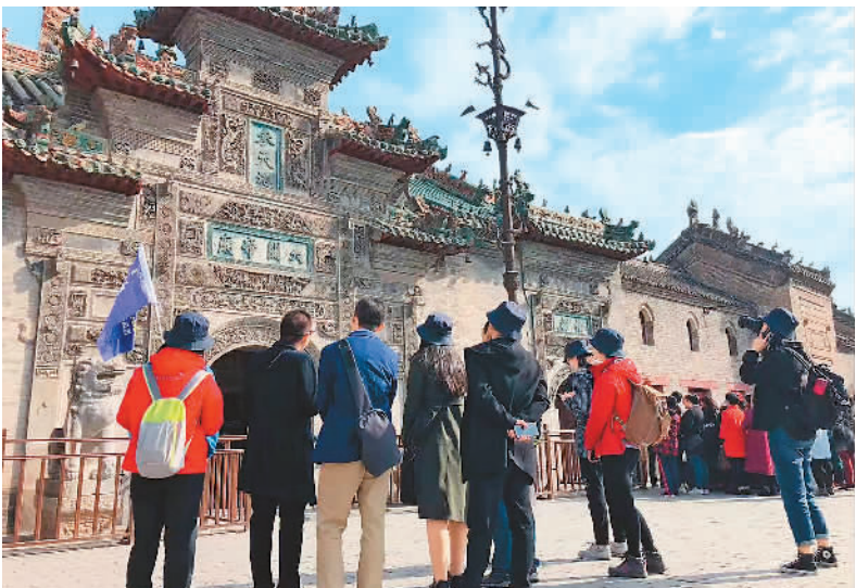
皖约研学在亳州花戏楼前考察

“皖约”活动推出了一系列记录安徽研学线路的短视频，其中《江淮流域徽派美食之味》《徽派建