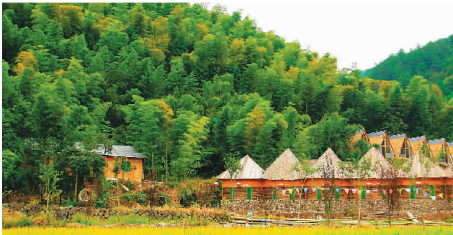
桐庐莪山畲族乡风光 来自网络