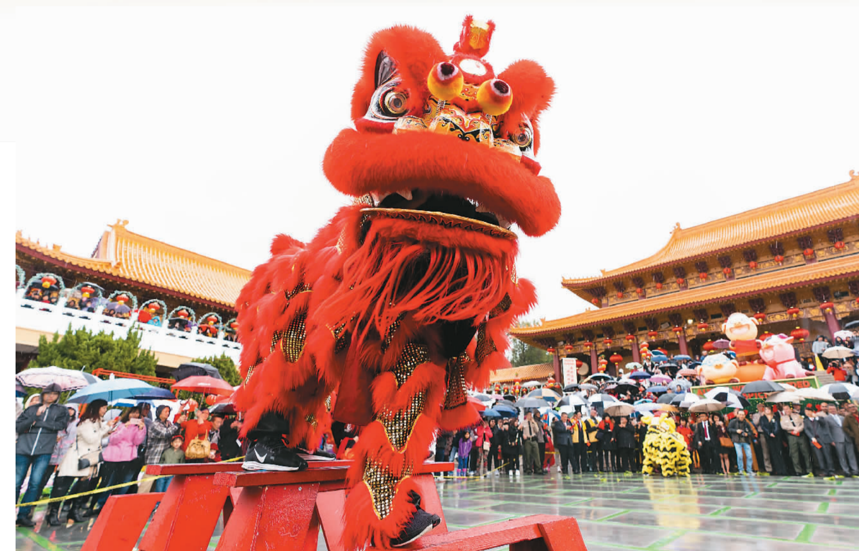
中国在世界的影响力越来越大，给海外华侨华人增添了空前的自信。近年来，每逢中国农历新年，精彩纷呈的庆祝活动会在许多国家展开，各国民众和华侨华人共同体验中国春节文化、共享节日快乐。图为二月五日，在美国加利福尼亚州洛杉矶附近的西来寺，人们观看舞狮表演。

“中国是生我、养我、育我的故土，是培养我、接纳我、成就我的热土。没有中国的改革开放，我绝不可能有今天的事业，更不可能取得今天的成就。”回望来时路，丁列明很感慨。从一名农家子弟，到接受高等教育，再到留学美国；从考取美国医生执照，到成为病理科执业医师，再到带着项目成果回国创业，丁列明这一路走得并不容易。不过，有付出终有回报。他带领团队研发出中国第一个小分子靶向抗癌新药，实现了自己的梦想和价值。“是祖国成就了我。我是中国发展的亲历