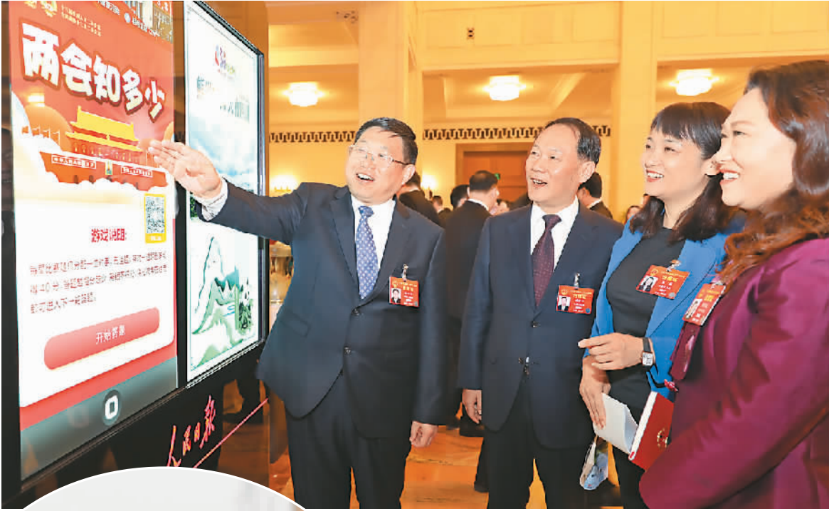
▲ 3月5日，几位全国人大代表在人民大会堂里，注意到首次设置在此的人民日报电子阅报屏，他们上前浏览两会信息、查阅有关数据。

很快，人民网微信公众号推出了一系列推送，解读政府工作报告中的民生福利：《2万亿！李克强宣布：实施更大规模减税》《定了！流量费将再降20%，全国实行