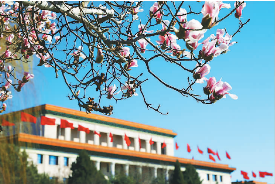
▲北京风和日丽，在春风的吹拂下，长安街新华门附近的玉兰花竞相绽放，在蓝天和红墙的映衬下格外美丽。