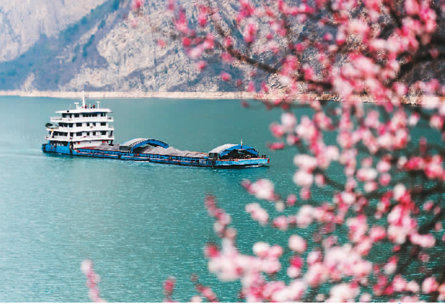
▲春暖花开时节，三峡库区沿长江两岸的山花、油菜花竞相开放，碧绿的江水、飘香的花朵以及雄伟的三峡构成美丽的春天图画。